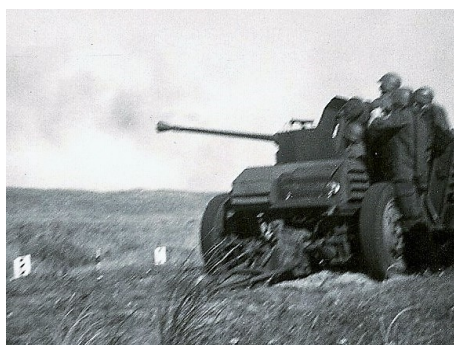
Skydning med 40 mm Luftværnskanon

Skydning i Nymindesgab.