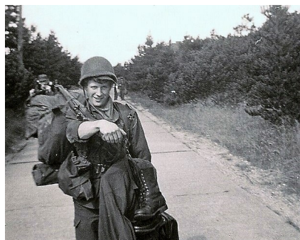
Der slæbes udrustning fra parkplads