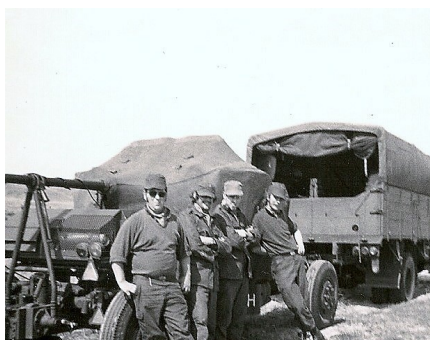
Kanonmandskab i venteområde