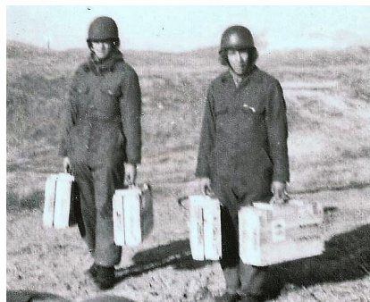
Afhentning af ammunition