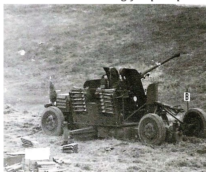
Kanon klargjort til skydning