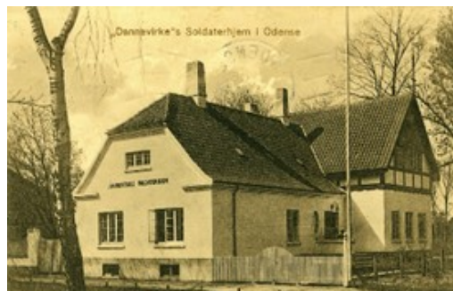
Dannevirke Soldaterhjem (Arkiv)

(Sammen med de andre fynske soldaterforeninger)