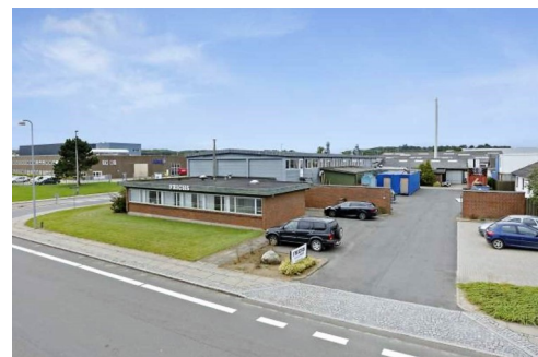
Frighs, Sverigesvej 16, 8700 Horsens

Sluttelig takkede formanden af og sagde tak for i aften.