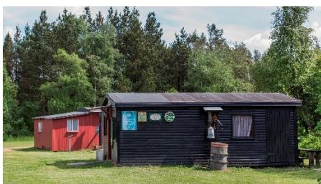
Søby Klondyke og Brunkulsmuseet

Efter rundvisningen og besøg på museum slutter vi besøget af med en sandwich og kaffe.