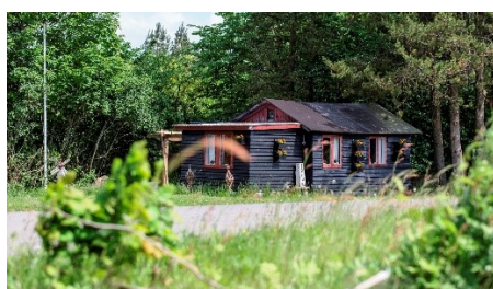
Barakbyen og Stines hus

Vi skal være mindst 30 personer og sidste tilmelding er den 26. maj 2018