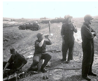
Der observeres efter slæbemål