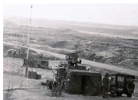
Ildlederstilling med antenner