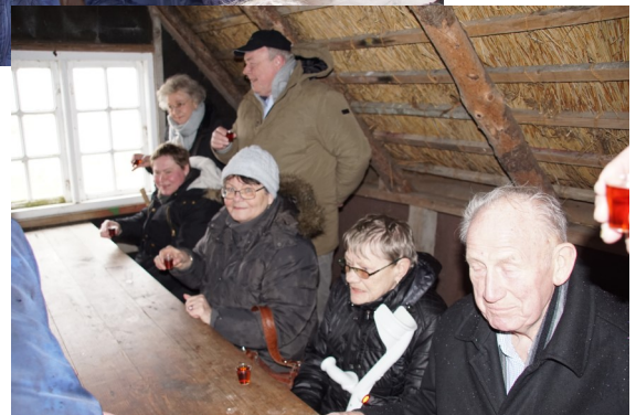
Foto fra Ese hytterne inden døre