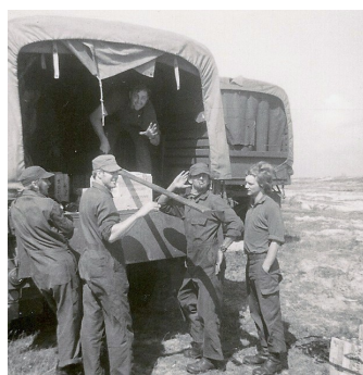
Klargøring af ammunition