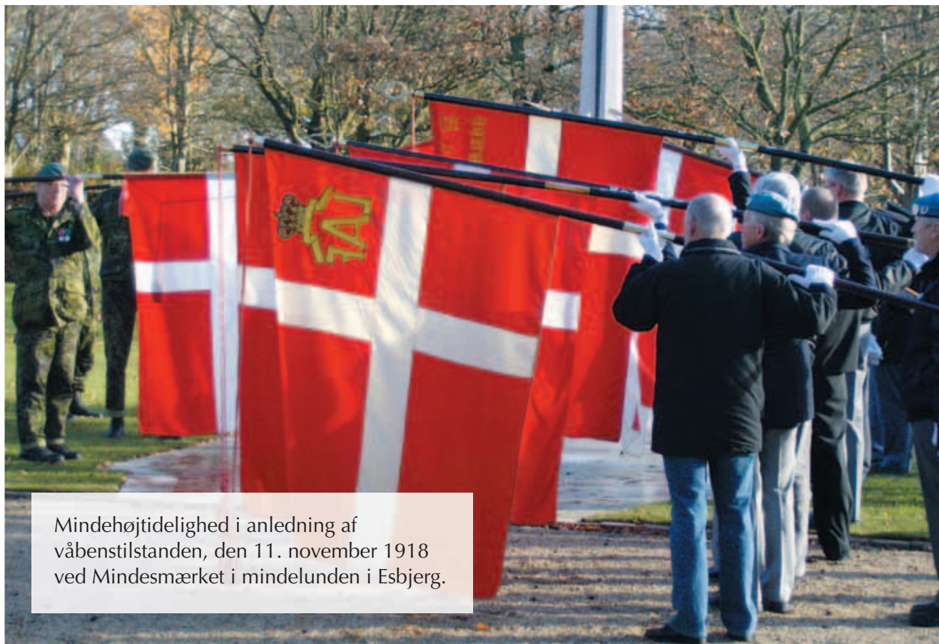
Mindehøjtidelighed i anledning af våbenstilstanden, den 11. november 1918 ved Mindesmærket i mindelunden i Esbjerg.