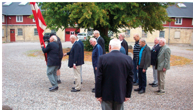
Luftværnsartilleristen Dag på Sandholmgård 2016 (arkivfoto)