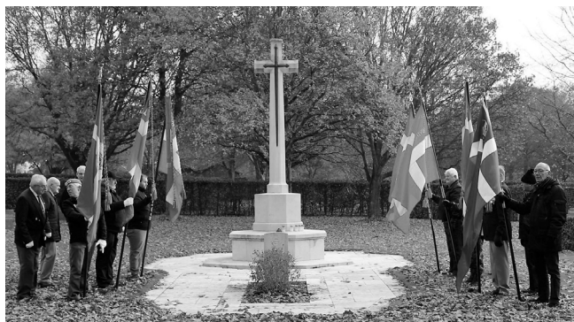
Gravlunden i Esbjerg

Mindehøjtidelighed i Gravlunden i Esbjerg den 13. november 2016, for afslutningen af 1. verdenskrig den 11. november 1918.