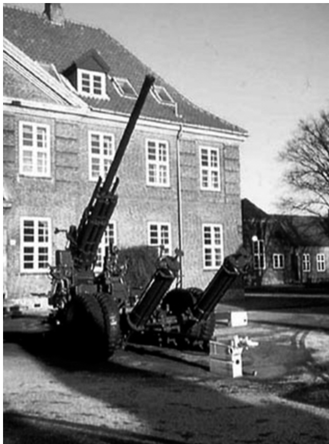
90 mm Luftværnskanon M/50