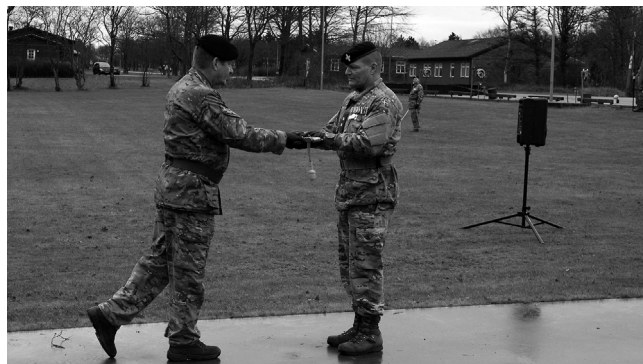
Chefoverdragelse i Oksbøl

Markeringen af Sct. Barbara dag den 4. december. Da dagen var en søndag, blev dagen markeret mandag den 5. december 2016 i Oksbøllejren ved 1. Danske Artilleriafdeling.