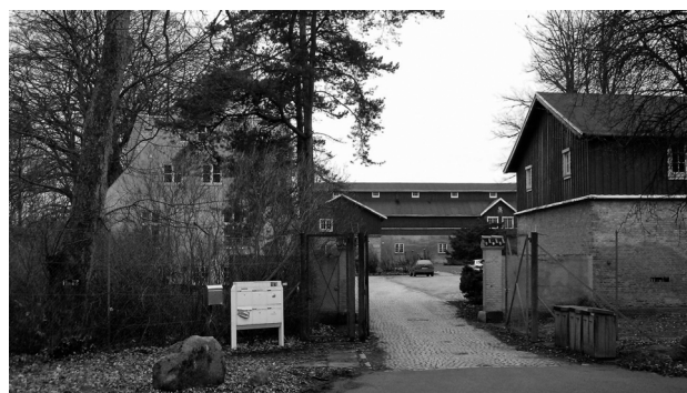
Indgang til Sandholmgård (Arkivfoto 2009)