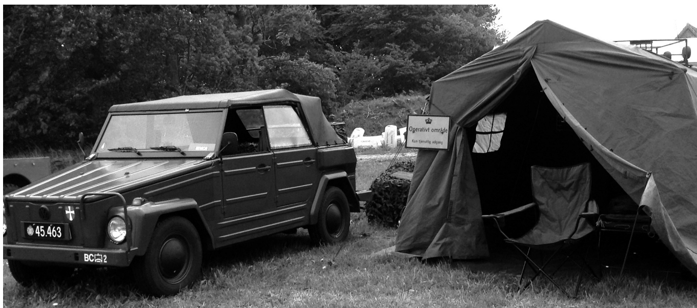
Jagtvogn 181 med telt (Arkivfoto)