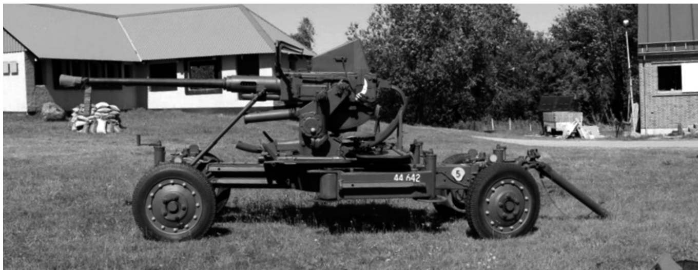
40 mm luftværnskanon L-60

Vi arbejder også på at skaffe billig overnatning med mulighed for fælles spisning i nærheden. Så hvis du allerede nu er interesseret, så giv mig lige et praj, så vi kan se om der er interesse for det.