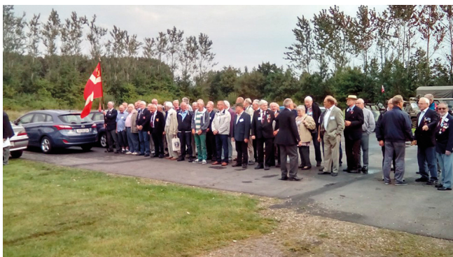
Luftværnsartilleristens Dag i Tønder 2016 (arkivfoto)

lender og kontakt derfor allerede nu dine soldaterkammerater så vi kan mødes så mange som muligt til et gensyn.