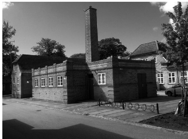
Badeanstalt i Avedørelejren