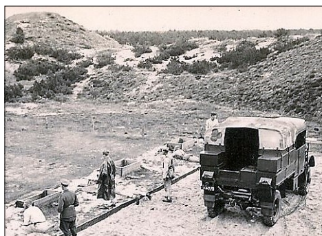
Skydning på feltbane