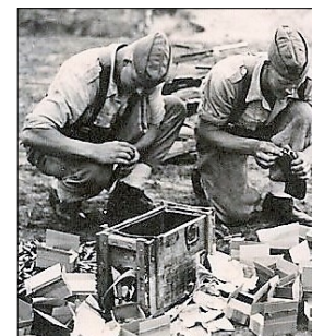
Soignering med mere