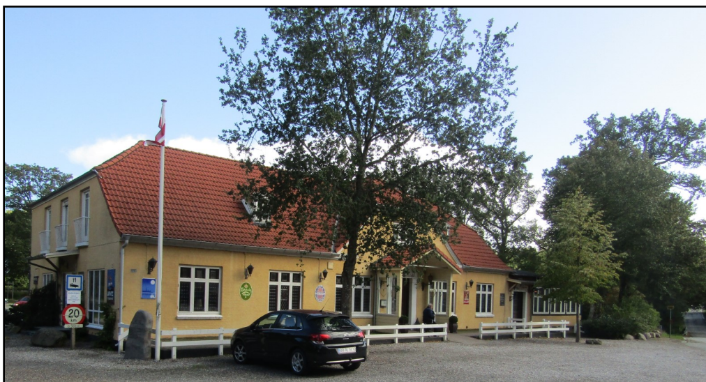
Rindsholm Kro, Gl. Aarhusvej 323, 8800 Viborg