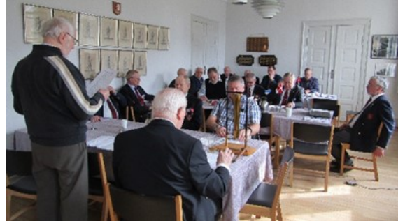
Landsgeneralforsamling 18. marts 2017 (arkiv)