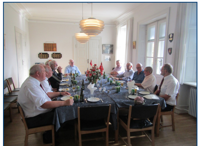
Her ses deltagerne + fotografen

Det blev en særdeles vellykket dag, vi var mødt 12 mand heraf var de 5 fra Fyn/Jylland. (- En fra Fyn - en fra Kolding - en fra Varde - to fra Lemvig)