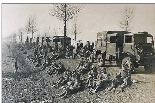
Hvil under transport på landevej