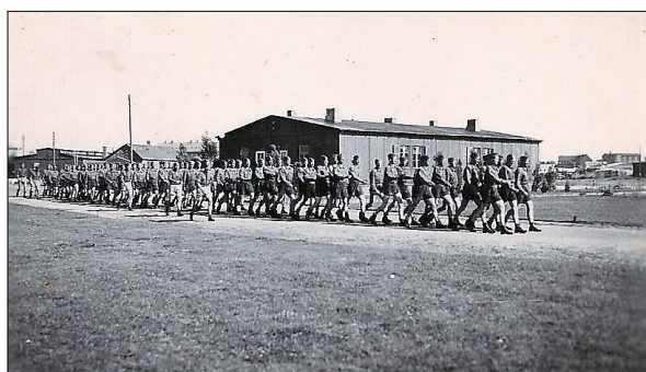
Marchtrædning ud af Artillerilejren