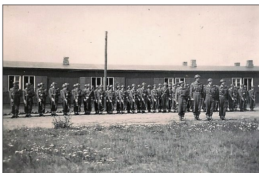
Parade i Artillerilejren