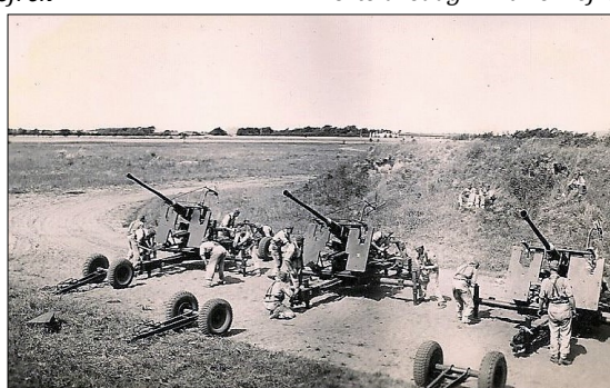
Vedligeholdelsestjeneste i felten