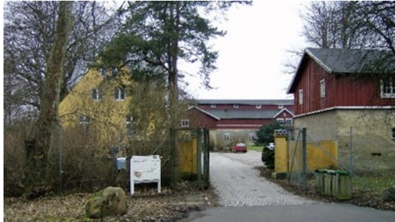
Indgang til Sandholmgård 2009 (arkiv)