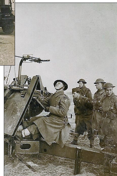
Målfølgning med kanon