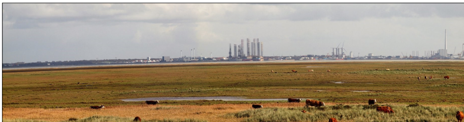
Et kig til Esbjerg fra sydspidsen af Skallingen