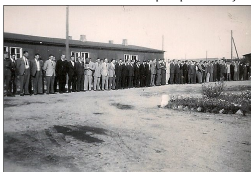
Hjemsendelsesparade i Artillerilejren