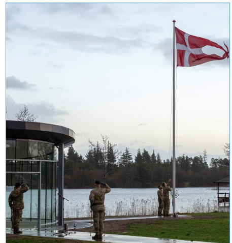
Esbjergs fane har deltaget i markeringen af Sct. Barbara ved mindesmærket i lejren den 4. december 2019.

Varde, den 10. oktober 2018 sign. Jørn Chr. Jessen Revisor for LAF Esbjerg