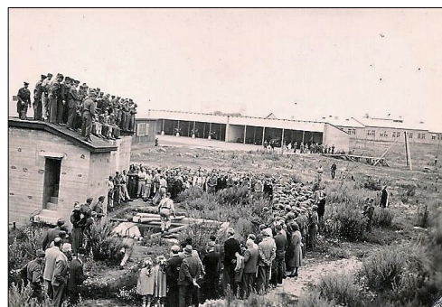
Forældredag i Artillerilejren