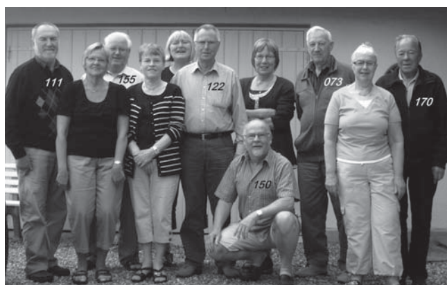
Her er de seks soldaterkammerater (385'er) årgang 58 – med påhæng. Foto med selvudløser (150) ved Bovense den 20. maj 2010