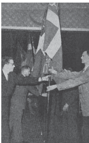
Århus, Odense og Esbjerg modtager deres faner.

Restaurant "Bellahøj" ligger smukt i udkanten af en park med en pragtfuld udsigt over byen. Her fejrede LAF i det smukkeste forårsvejr sin forårsfest.