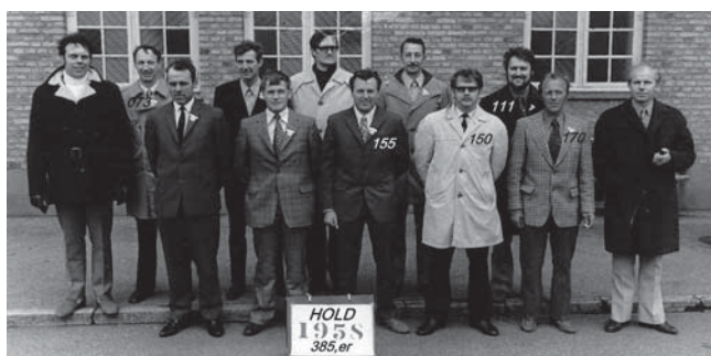
LAF 10 års jubilæum

Dette var indledningen til et herligt venskab som har stået på i mere eller mindre omfang i de godt 50 år der er gået efter soldatertiden. Vores venskab blev