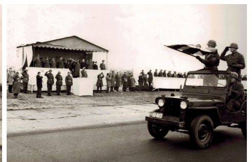
Kongeparade på FSN Skrydstrup