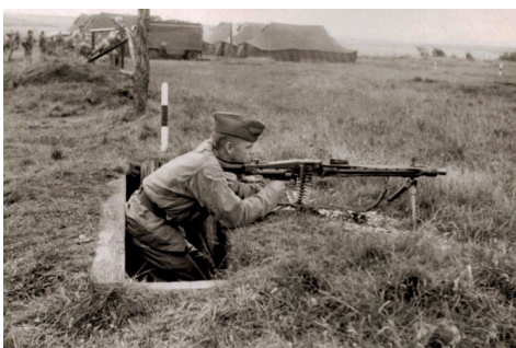
Feltskydning fra skyttehul