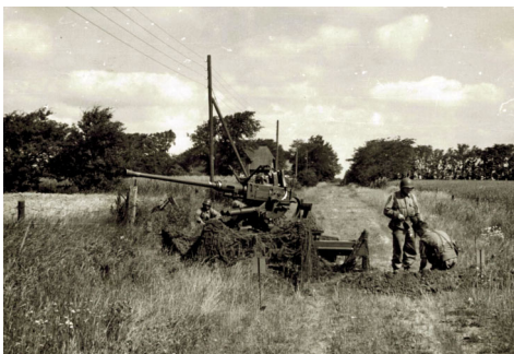
40 mm Luftværnskanon i stilling