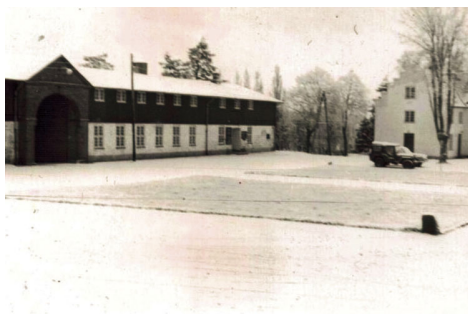
Søgårdlejren – Vinterfoto