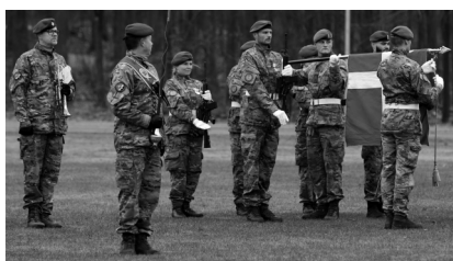
Fanen fra Hærens Efterretningscenter