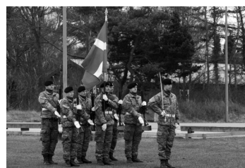
Fanen fra Hærens Kamp- og Ildstøttecenter

Senere på dagen var der "TIME TO REMEMBER" gudstjeneste i Zions Kirke, Esbjerg.