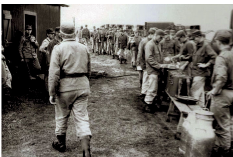
I kø for at få forplejning