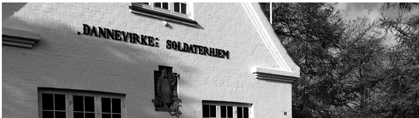
Dannevirke Soldaterhjem, Odense

(Sammen med de andre fynske soldaterforeninger)