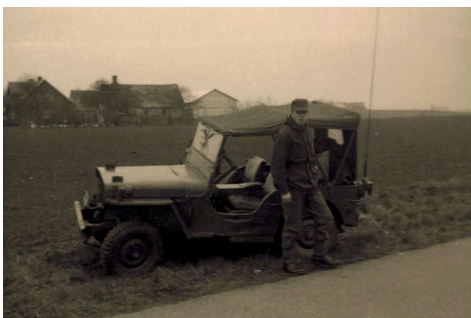
Kører venter på hans vognkommandør