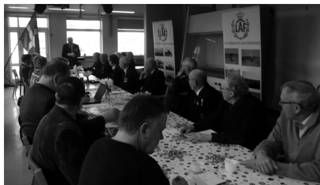
Landsformanden læser årsberetningen op

Beretning godkendt uden yderligere kommentarer.