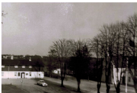
Søgårdlejren set fra hovedbygning