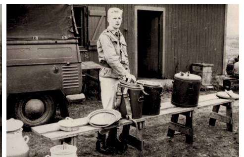
Klargøring af forplejning