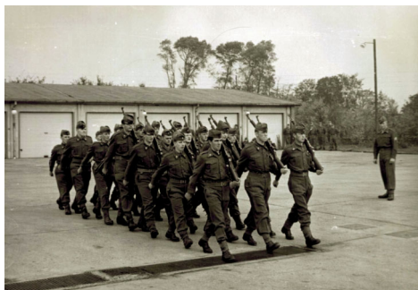
Der øves eksercits