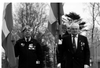
Fanen fra De Blå Baretter og LAF Esbjerg