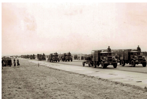
Kongeparaden på FSN Skrydstrup