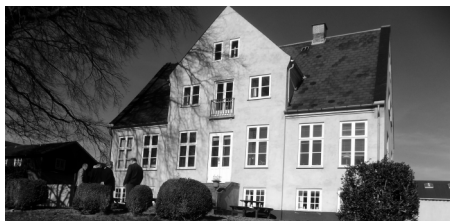
Sandholdgård fra havesiden (arkiv)

Vi mødes ved Sandholmgård, Ellebækvej 11, 3460 Birkerød