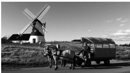
Tur på Mandø

Vadehavscentret – Porten til Unescos Verdensarv – er åbent til klokken 17.00