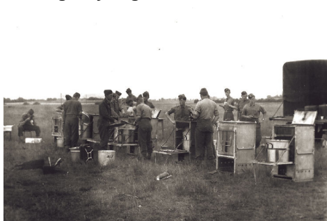
Udlevering af forplejning