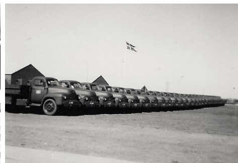
Opmarch af nye Bedford-lastvogne