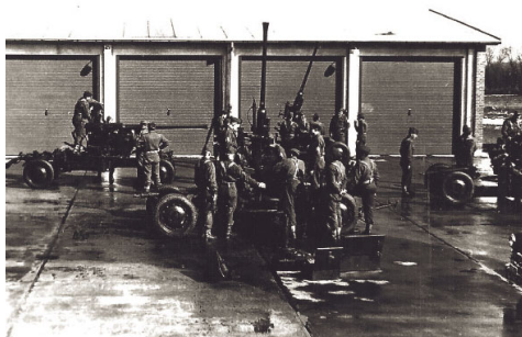
Vedligeholdelse af kanoner - 2