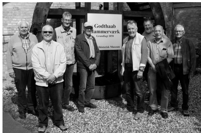
Deltagere i rundvisning

Initiativet lykkedes heldigvis, så Hammerværket i dag fremstår som et stykke unikt og velbevaret virksomheds historie, som efterhånden besøges af mange mennesker hvert år. Virksomheden med tilhørende arealer og kanalsystemer til vandmøllen, er i dag fredet. Virksomhedens gamle maskiner holdes ved lige af den frivillige aktivitets gruppe. Hammerværkets omkostninger til vedligeholdelse m.m. finansieres ved tilskud fra Aalborg Kommune og forskellige