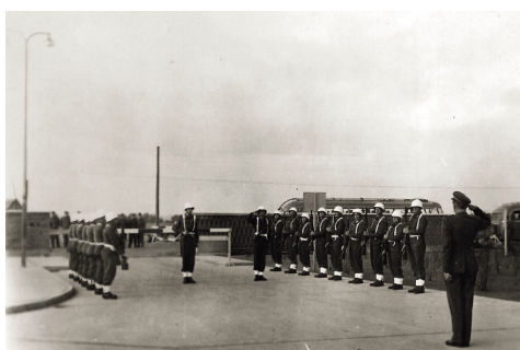
Vagtafløsning Hvorup Kaserne