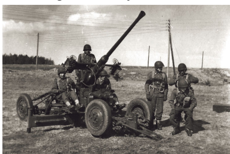
Øvelse med 40 mm Luftværnskanon L/60