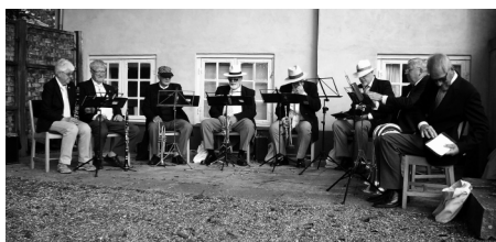
Jernløse Hornorkester underholder (arkiv)