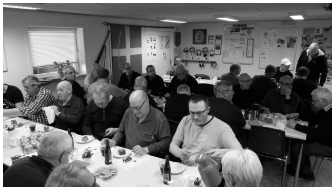
En del af aftenens deltagere

Alslev Skytteforeningen sørgede både for faciliteter, hjælpere samt kaffe og hjemmebagt brød.