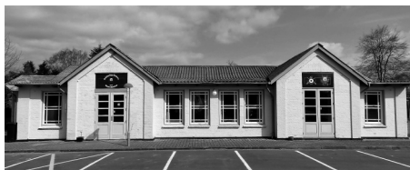
Tønder Skyttekorps lokaler