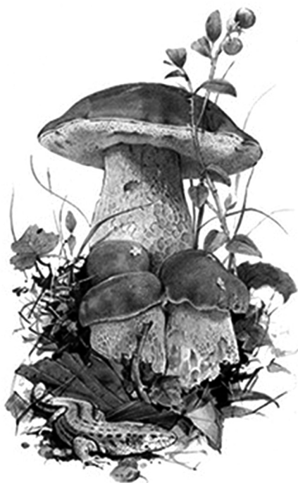
Karl Johan – spiselig rørhat

LAF – Midt Vest Afdeling arrangerer en tur i Klosterheden for at samle svampe.