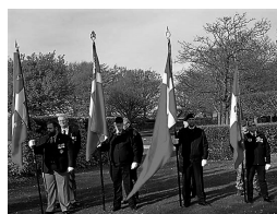
I Gravlunden i Esbjerg

I anledning af markeringen af DYBBØL-dag den 18. april 2017 for slaget ved Dybbøl Banke 1864.