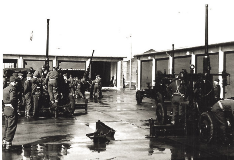
Vedligeholdelse af kanoner - 1