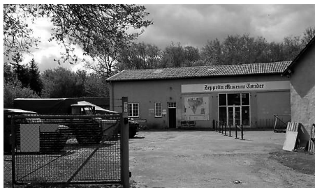
Zeppelin- & Garnisonmuseum Tønder

Vi mødes ved Zeppelin- & Garnisonmuseum Tønder, Gasværksvej 1, 6270 Tønder