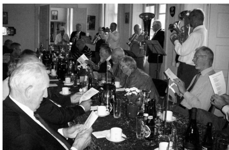
Fællessang med Jernløse Hornorkester (arkiv)