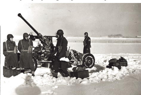
Kanon i stilling med sne