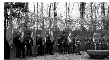
I Mindelunden i Varde

I anledningen af markeringen af Frihedsbudskabet den 4. maj 2017, – I Gravlunden i Esbjerg og I Mindelunden i Arnbjerg Anlægget i Varde