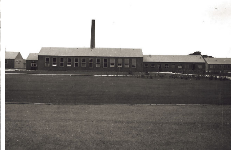
Kostforplejningen på Hvorup Kaserne