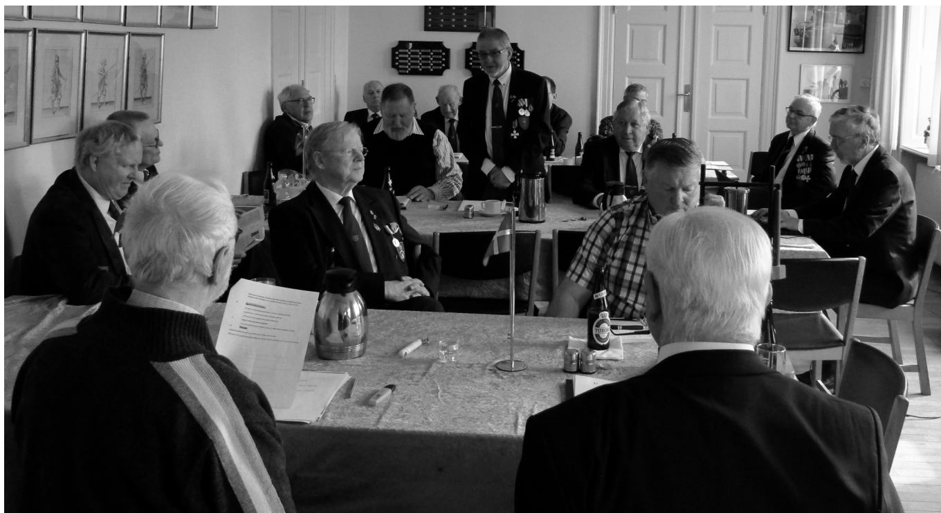
Deltagere i landsgeneralforsamlingen