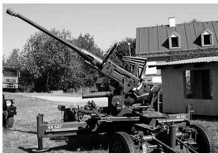
40 mm Luftværnskanon L/60