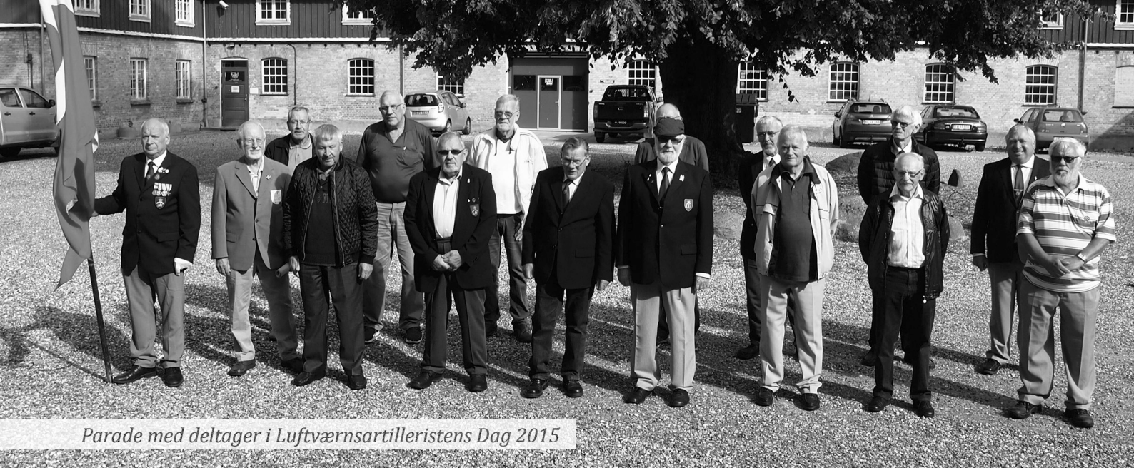
Parade med deltager i Luftværnsartilleristens Dag 2015