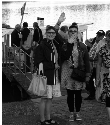
Der vinkes farvel og tak for i dag