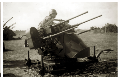
Firling med mange hylstre foran