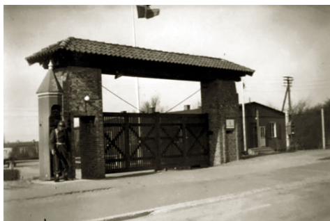
Hovedindgang Artillerilejren Esbjerg