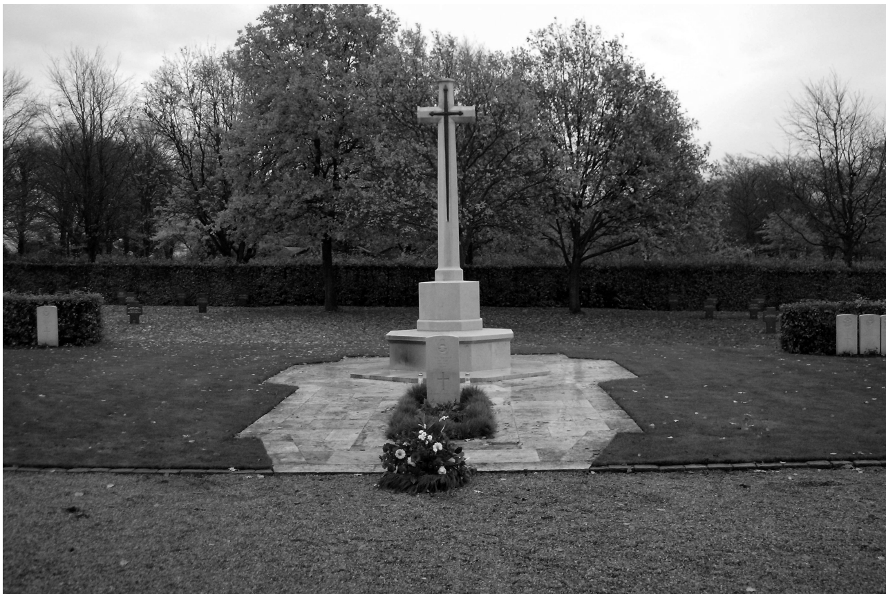
Gravlunden i Esbjerg (arkivfoto)

Efter mindehøjtideligheden serveres kaffe og rundstykker på Hjemmeværnsgården, Veldbækvej 48, 6705 Esbjerg.