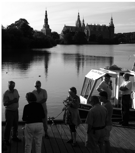
Pause ved Hillerød Torv