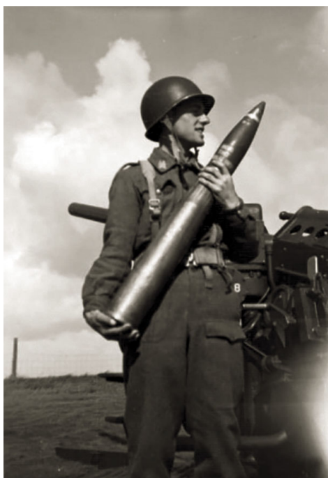
90 mm granat