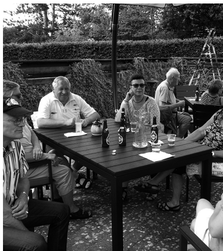
Hygge ved sommerhus

Efter en kort sejlpause ved Hillerød Torv, hvor en del skulle have en isvaffel og der blev taget foto så man havde et minde med hjem. – Herefter sejlede vi en tur mere og nød det gode vejr.