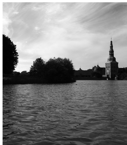
Udsigt til Fredensborg Slot