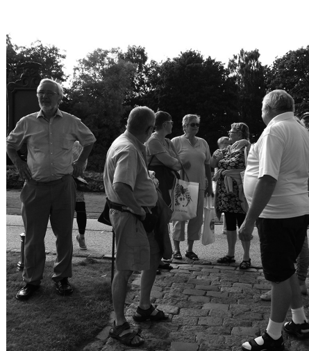
Venter på båden