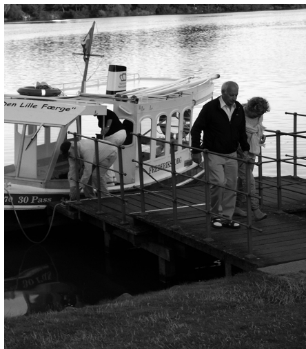
Man går fra borde