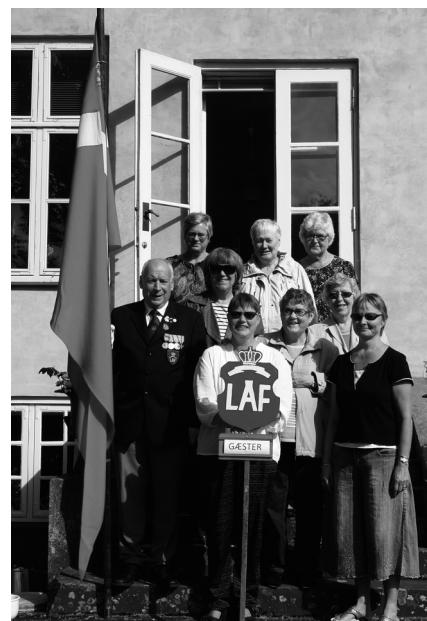
Pårørende til jubilarer