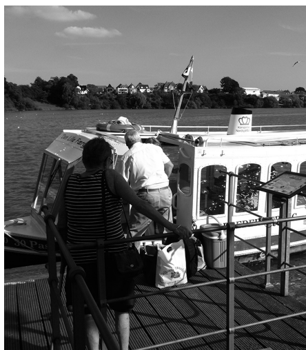
Man går ombord