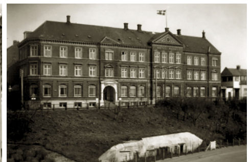
Hotel Royal Esbjerg