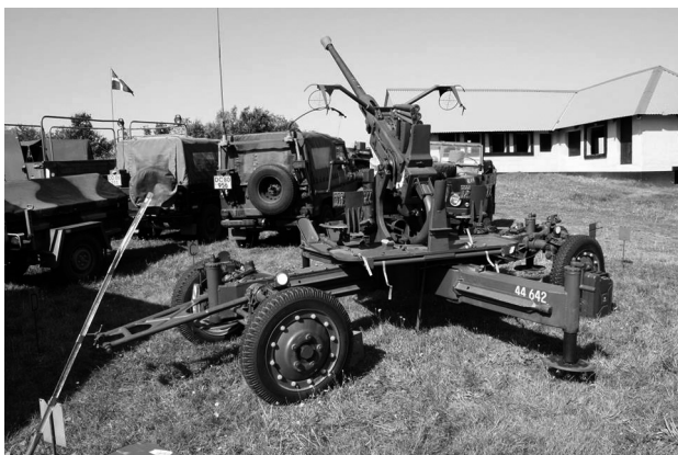
40 mm Luftværnskanon L/60

LAF Midt Vest Afdeling og Zeppelin- og Garnison Museum i Tønder har slået os sammen og deltager i showet. Der var udstillet 40 mm luftværnskanon, med tilbehør en firling med 12.7 mm, Stinger i trefod samt mange forskellige våben m.m. Vi havde også 9 forskellige køretøjer fra den tid.