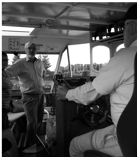
Næstformanden takker for turen