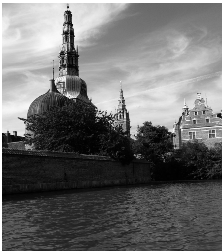
Udsigt til Fredensborg Slot

Den nuværende færgе har sin helt specielle historie, idet den er bygget som reserve redningsbåd for hospitalsskibet Jutlandia, da det blev udrustet til sin indsats i Korea-krigen. Skroget er således konstrueret til at redde skibsbrudne i Stillehavets bølger. At sejle med turister på Slotssøen er jo en noget roligere tilværelse.