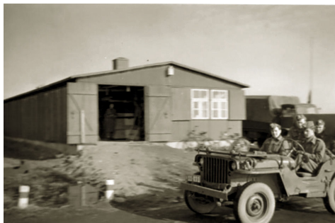
LT Schøller og 4 korporaler