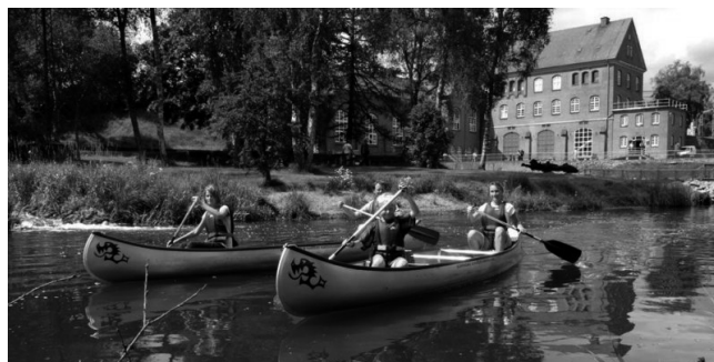
Kanoer på Tangesø