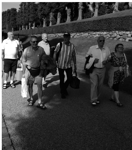
På vej til båden