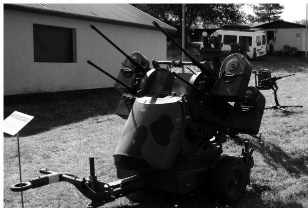
Firling med 12,7 mm

Jeg startede om onsdagen med at sætte materiellet op sammen med Tønder folkene, kanonen og firlingen kom fra Karup om onsdagen, så tiden gik med at køre vores materiel på plads. Det var en spændende opgave at hjælpe med at få det til at køre. Hele udstillingen kørte virkelig godt – jeg prøvede så godt jeg kunne at forklare de som var interesseret i det materiel som vi brugte i 1970-1980.