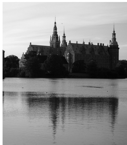
Udsigt til Fredensborg Slot