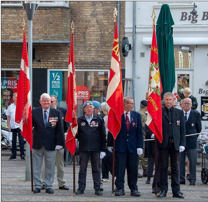
Varde Torv - Formiddag