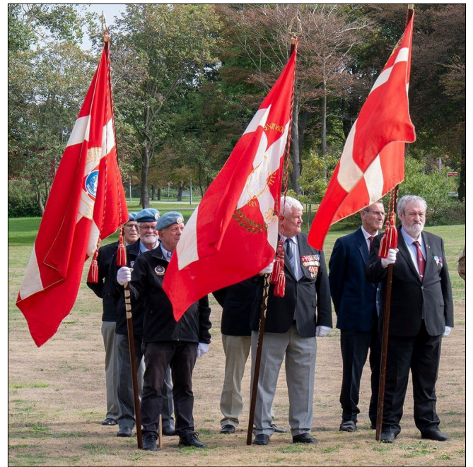
Ved mindesmærke i Oksbøl