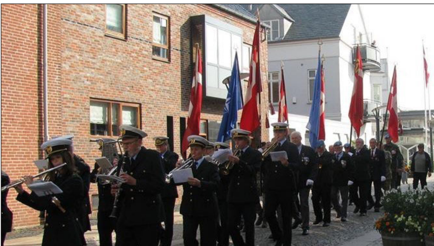
LAF Esbjergs fane med Politiorkester i spidsen til Esbjerg Torv