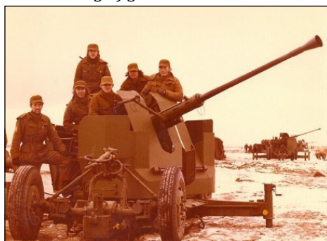
2. kanon med besætning