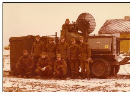
Skyderadar med besætning