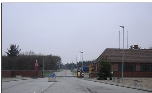
Hovedvagten Nymindegab Lejren - arkivfoto