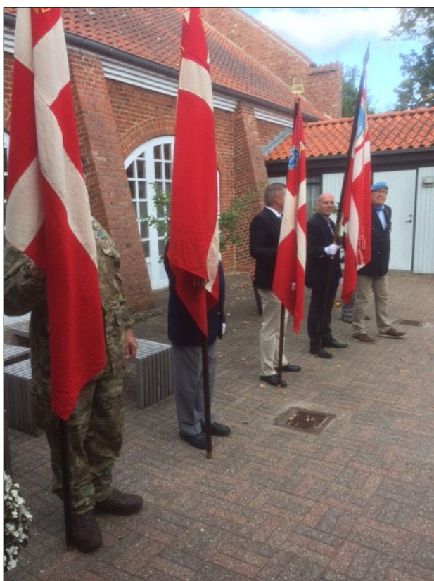
Faneborg med 4 faner udenfor Ullerup Kirke