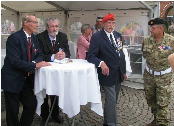
LAF-Esbjerg - Veterancafe Esbjerg - Danske Veteraner Esbjerg