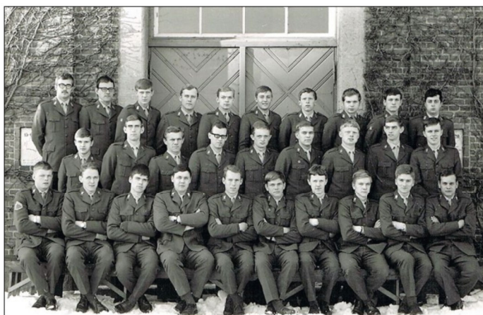
Sergentelev holdet på Artillerietsbemandsskole 1969