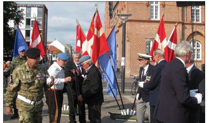
Esbjerg Torv - Eftermiddag