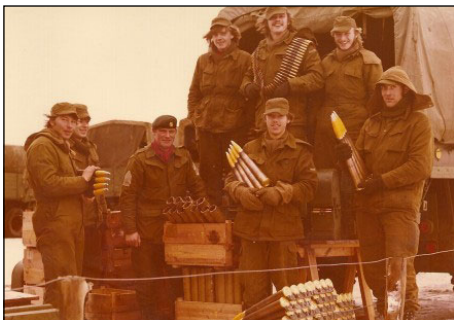
Udlevering af granater