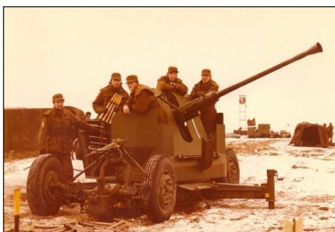
1. kanon med besætning