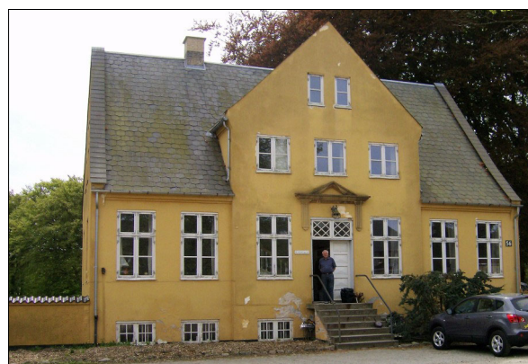
Hovedbygningen til Sandholmgaard