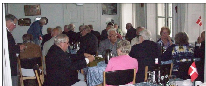
Man hyggede sig ved bordene

Herefter var der oprydning så lokalerne atter kunne tages i brug af andre.