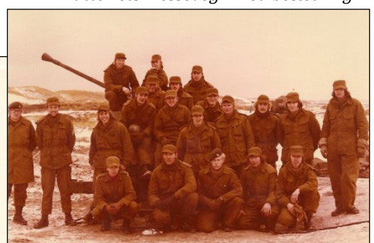
1. deling med besætning