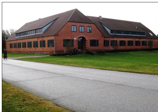
Indkvarteringsbygning m.m. - arkivfoto

og stoppede hjem, men så var den søndag også brugt, men det var spændende, især fordi det var imod forskrifterne.