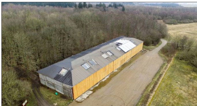
Flyhangaren i "Soldaterskove" sommeren 2018.