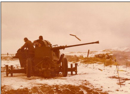
40 mm Luftværnskanon

2. Luftværnsafdeling, Jyske Luftværnsregiment 1973.