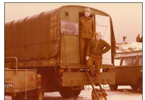
Batteriets messevogn med besætning