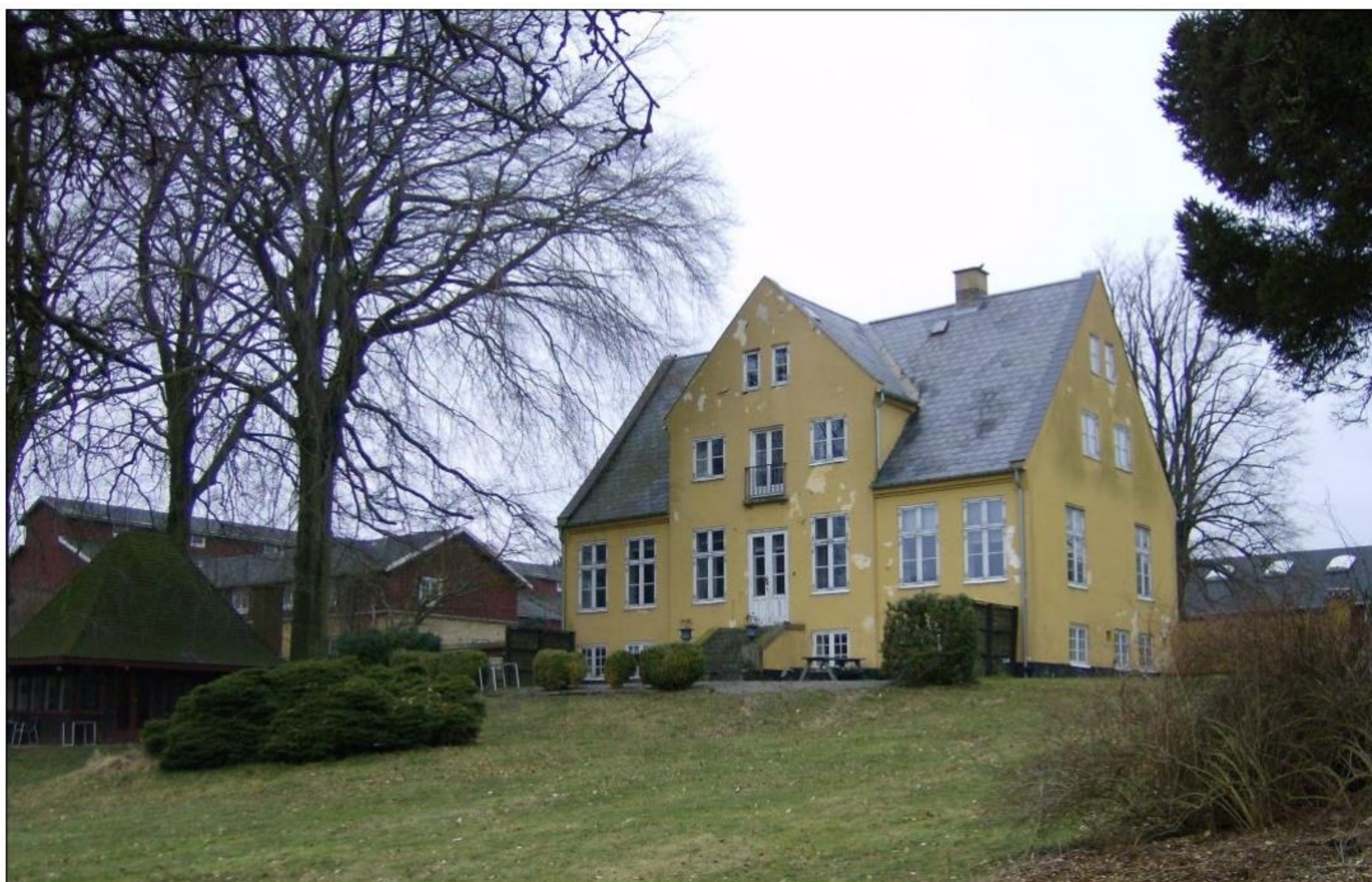
Bagsiden af Sandholmgård (Arkivfoto)