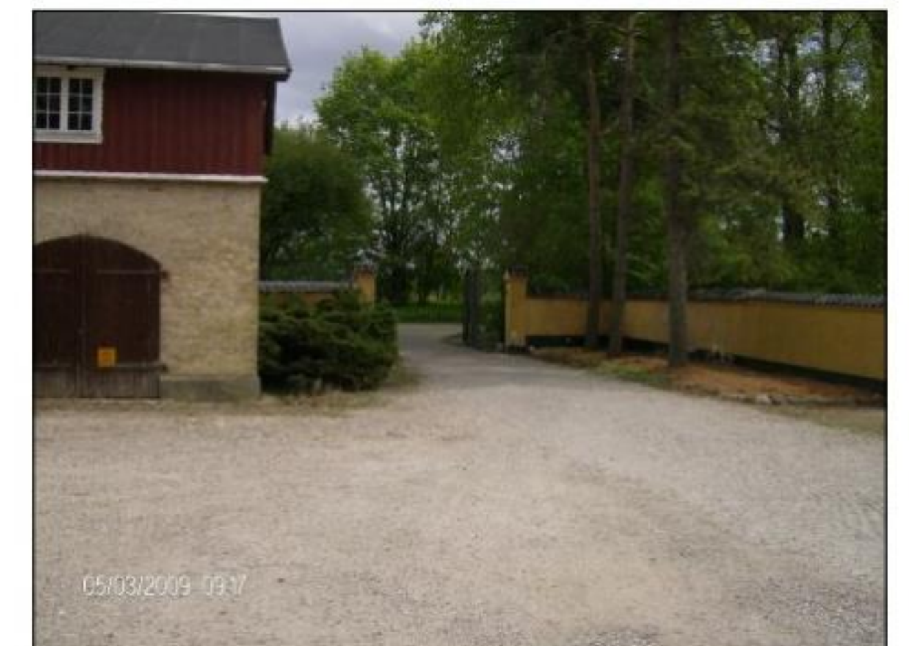
Luftværns-Artilleri-Foreningens domicil Sandholmgård, Ellebækvej 11, 3460 Birkerød