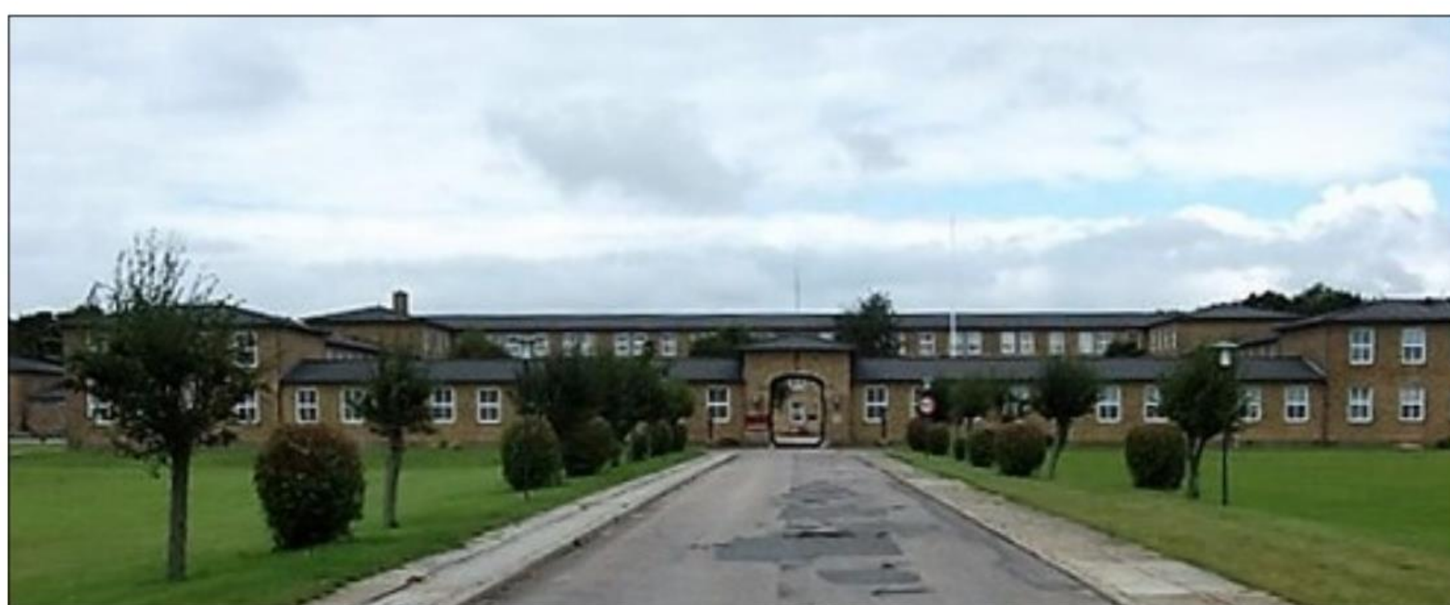
Tønder Kaserne (arkivfoto)

Inden spisningen var der mulighed for at komme til kasernen og se/gense den som den ser ud i dag. Vi havde også mulighed for at komme ind og se Flyhangaren i "Soldaterskoven" og komme indenfor.