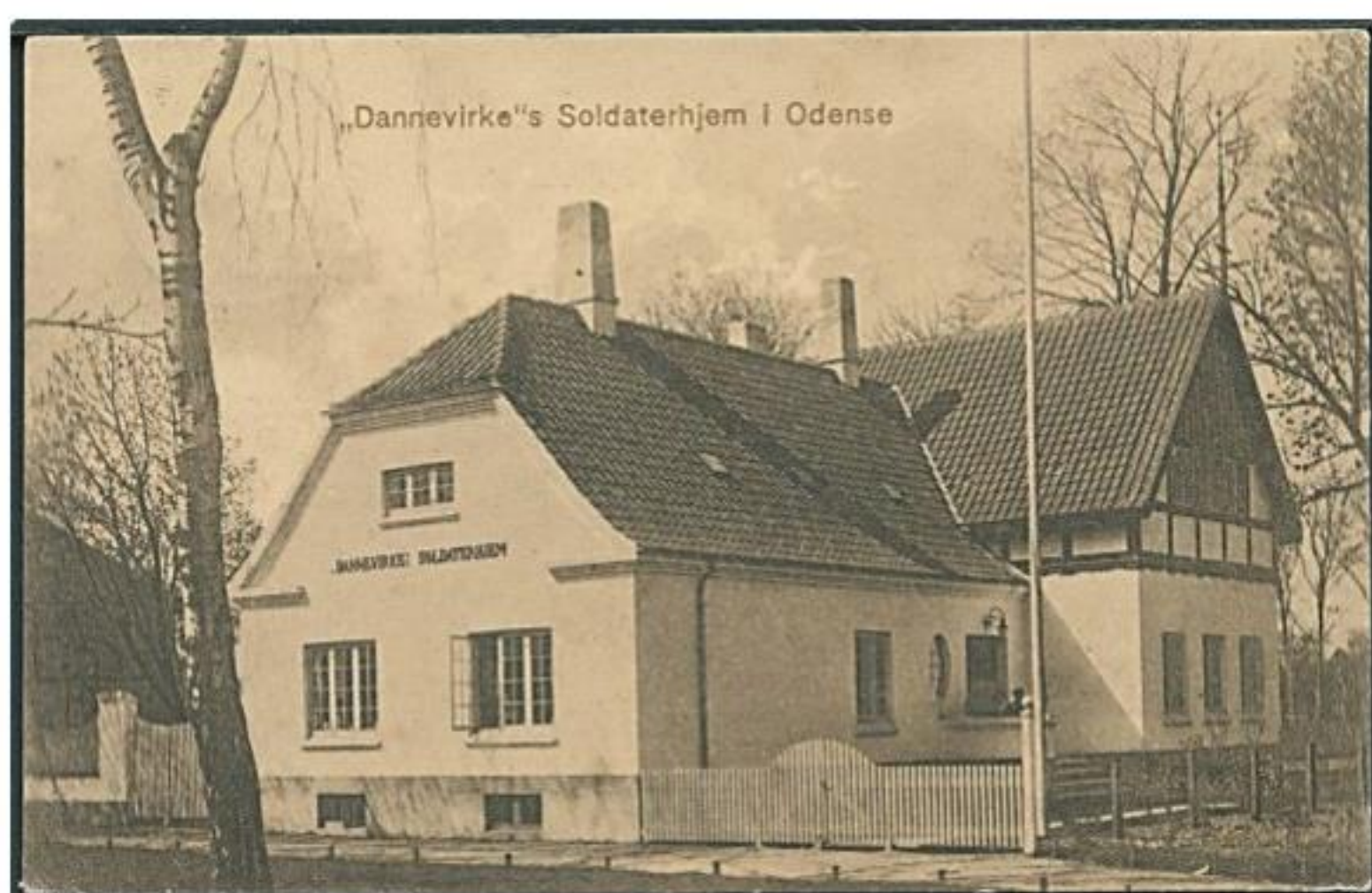
Dannevirke Soldaterhjem (arkivfoto)

(Sammen med de andre fynske soldaterforeninger)