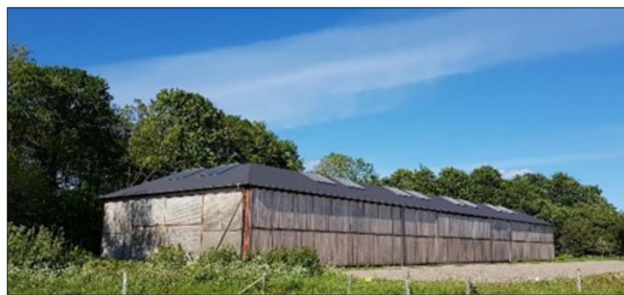
Flyhangar i Soldaterskoven (arkivfoto)

Efter at man havde guset Kasernen/ Flyhangaren mødtes deltagerne i Tønder Skyttekorps lokale kl. 13.15 til fælles middag som var Gule ærter med tilbehør samt pandekager med is og kaffe. Her fortsatte den kammeratlige samvær.