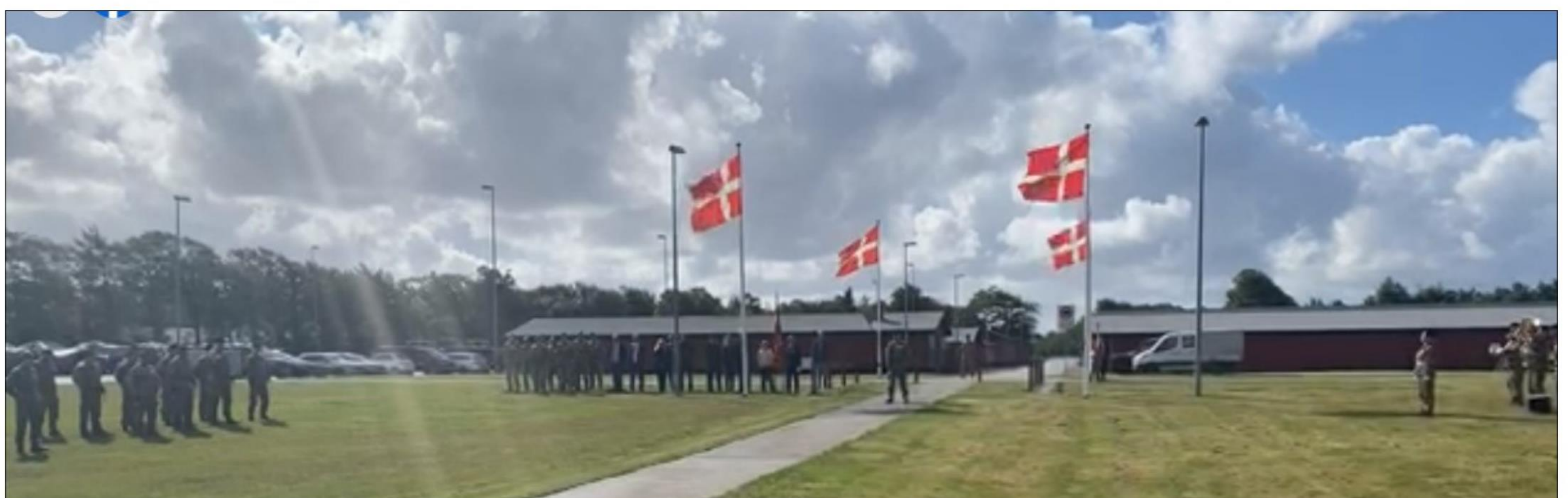
Flagparade - Danske Artilleriregiment - Oksbøl Kaserne