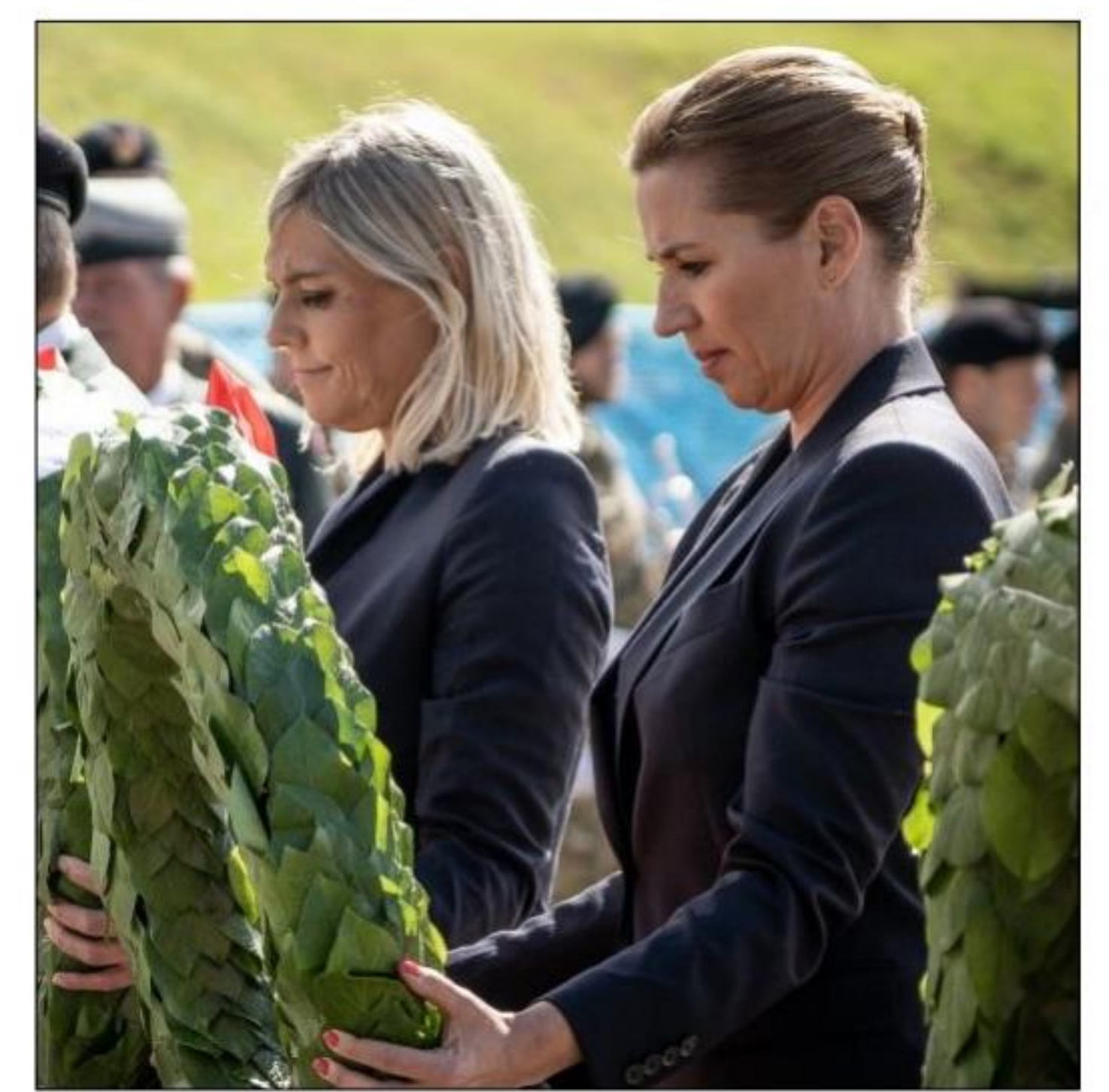
Veterancenter - Ringsted Kaserne