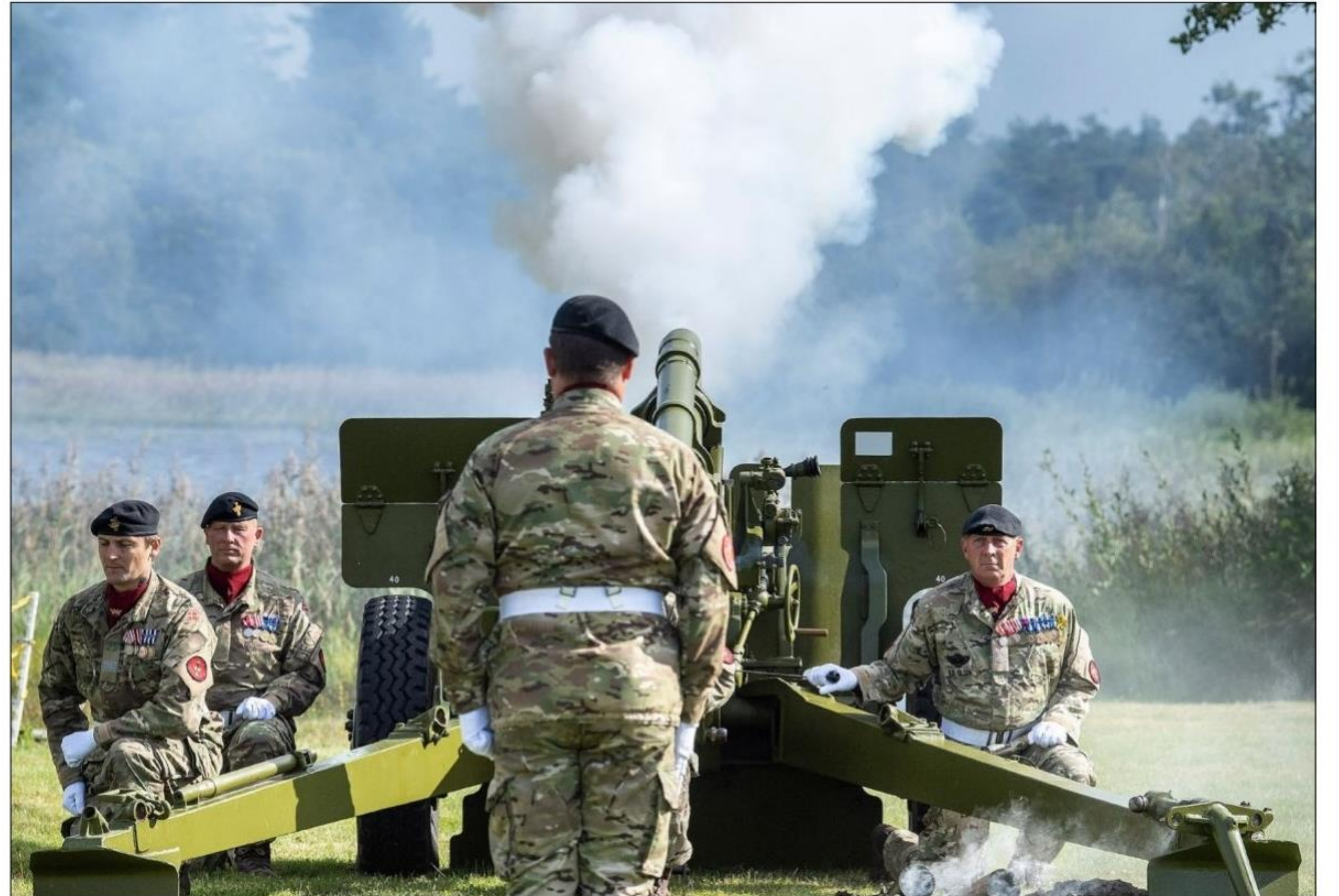
Dansk Løsen, Danske Artilleriregiment, Oksbøl Kaserne