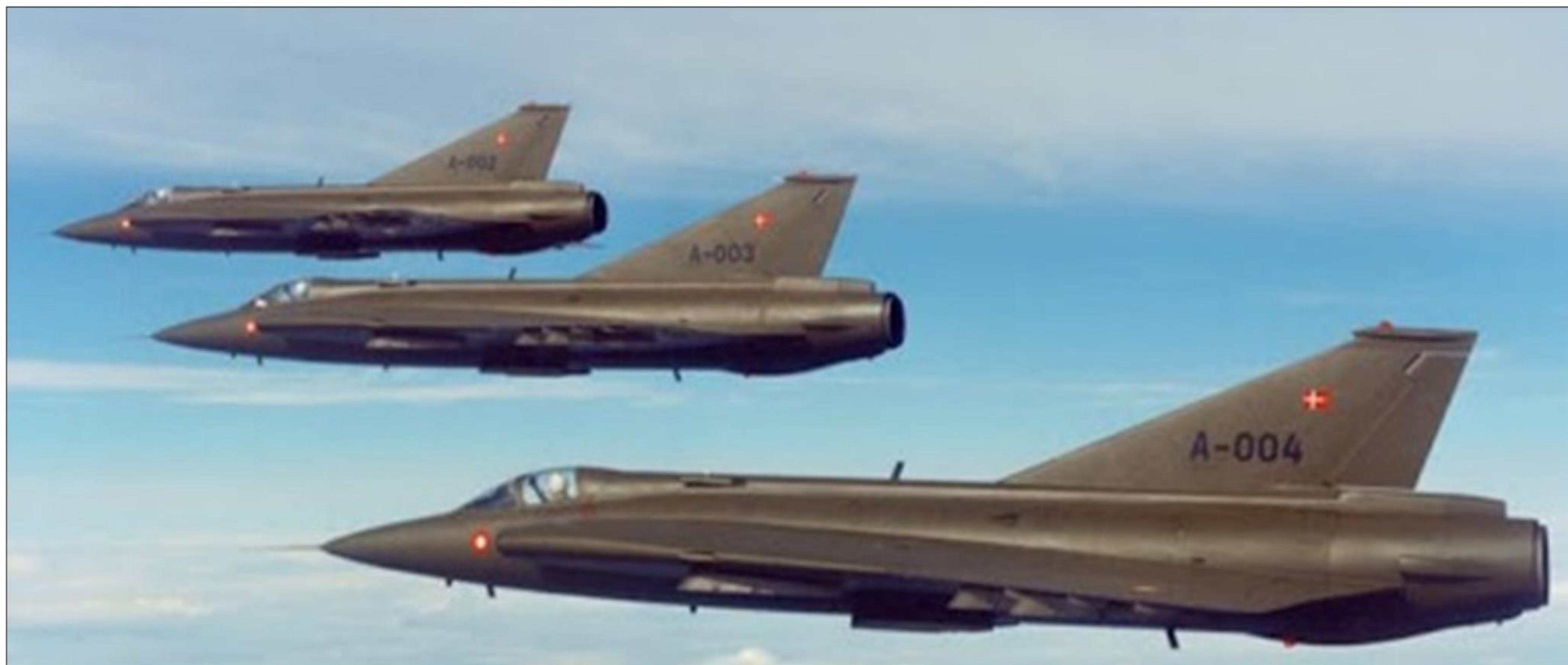
Danske Drakenfly som blev modtaget i 1970

Vores opgave var at nærsikre flyvepladsen med vores 40 mm Luftværnskanoner og Firlinger.