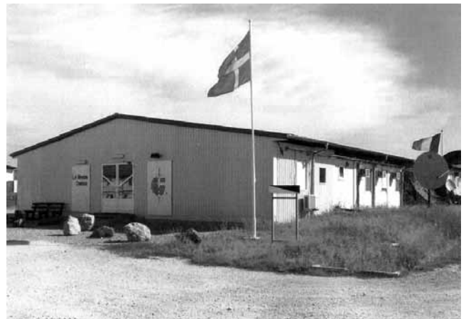
Det Danske Hus hvor vi bor

Byggeriet har kronede dage, for det er i gang stort set alle steder, men nybygningerne står tit tomme eller ikke helt færdige. Mange Albanere fra Europa bygger et hus her for at have et sted at tage hen senere. Men det er et område i en rivende udvikling, og der er da håb for, at man kan begynde at leve i fred. Der er stadig områder, hvor begge parter lever i nærheden af hinanden, men sjældent som naboer, da krigen stadig er tæt på i deres hukommelse, med