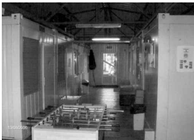
Det Danske Hus indvendigt

Børnene er begyndt i skole hernede den 4 SEP, og når man har børn i skole, skal man selv ud at købe bøger til dem. Det gør så de, der har råd, og andre låner eller køber brugte slidte og måske forældede bøger. At skulle købe bøger til 3 børn i skole koster ca. 500 Euro, ca. 3700 kr., måske ikke meget tænker nogen, men det er en månedsløn, for dem der har en god løn her, og så kan man måske sammenligne det bedre, hvis man tænker på, at man selv skal betale en månedsløn brutto efter danske forhold. De er næsten ude i en ond cirkel, hvor det kun er dem med penge, som er sikre på at komme videre, dem fra landet har i hvert fald ikke store chancer for at få råd.