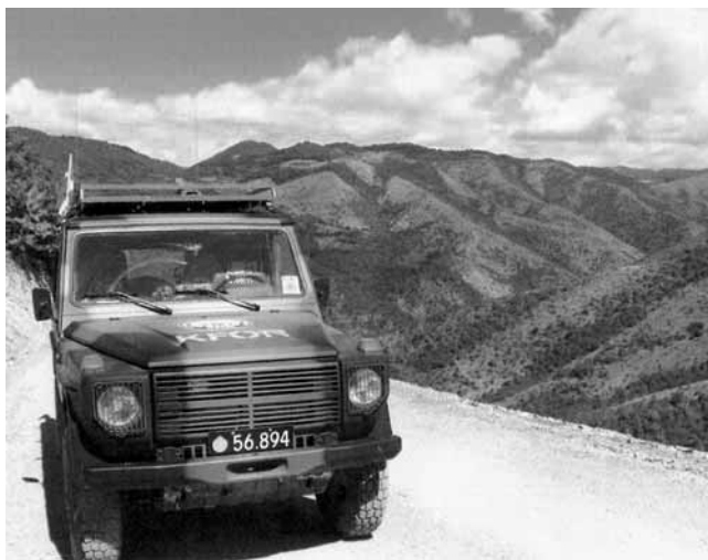
Udsigten på en af vore ture i området

Jeg tog hjem fra Kosovo Februar 2005, og det var lidt spændende at komme tilbage og se, om der havde været en udvikling, og i hvilken retning det så var. Jeg havde ikke troet, at der var sket så meget, men det er i den positive retning, at der er sket en udvikling. Affaldet, som tit lå alle mulige steder, er der ikke så meget af mere, dog er der steder, hvor man til stadighed smider sit affald. Men renovationen er begyndt at virke, så der bliver fjernet affald, men spørgsmålet er så måske, hvor det derefter ender og på hvilken måde. Byerne, som vi har set, er blevet renere og rendestenene bliver rensset og de steder hvor folk smider noget, heldigvis bruger man samme steder, bliver tømt ind i mellem.