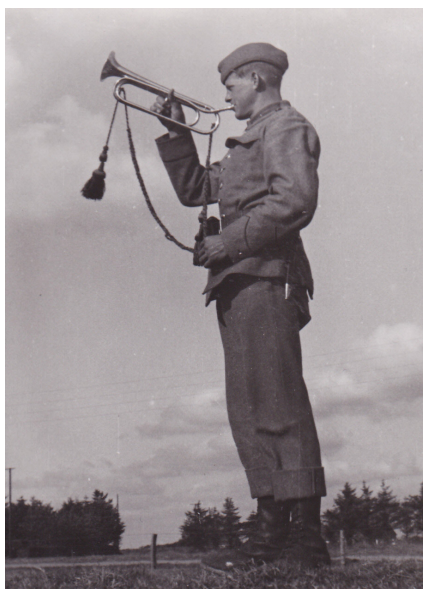
Der blæses retræte