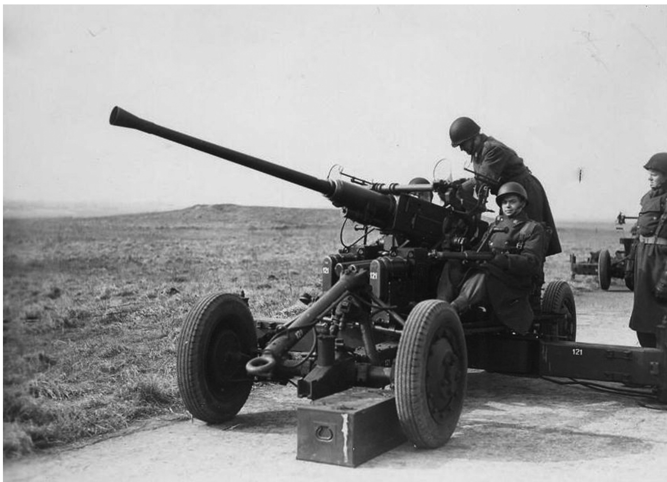
40 mm Luftværnskanon, L-60