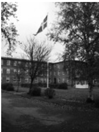
Flaget hejst i den forhenværende kaserne gård

Det var derfor med store forventninger min kone og jeg kørte fra Albertslund lørdag morgen for at mødes med 37 gamle soldaterkammerater på Tønder Kaserne, hvor der ifølge programmet var samling kl. 13,00. Det var et glædeligt gensyn med den gamle kaserne, hvor flaget var hejst. Jeg var spændt på hvad der nu var i de gamle bygninger. Det viste sig at SKAT havde kontorer i en stor del af bygningerne. Vi mødtes i deres kantine og blev budt velkommen af 728. Herefter tog en af SKATs medarbejder over og fortalte lidt om hvad der blev arbejdet med i de gamle ombyggede lokaler. Der var herefter en rundgang og gensyn med de "gamle" lokaliteter.