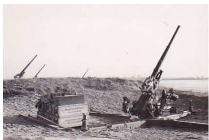
Indretning af lejr fortsat