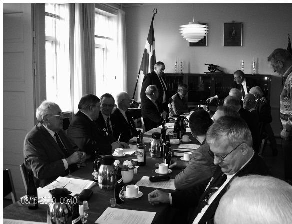
Generalforsamling (Arkivfoto 2009)