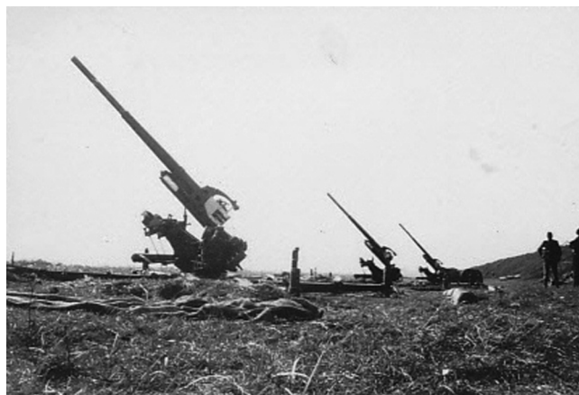
75 mm Luftværnskanon Arkivfotos

Nogle tyske maskiner forsøgte at lande, men det blev de forhindrede i af ilden fra batteriet. Straks efter at de første skud var affyret gik maskinerne så lavt at kaptajnen ikke turde skyde af hensyn til mandskabet ved korrekturen, og jagerne skilte sig ud fra de øvrige og tog kurs mod batteriet i så ringe en højde, at vore topfine 75 mm kanoner måtte stå tavse og se til, men alt kunne tyde på at de tyske flyvere var klar over at vi ikke kunne bruge kanonerne, ellers havde de sikkert ikke fløjet så frimodig ind til et så stærkt armeret batteri, og med 2 kaptajner og en sværm af danske soldater, der kun ventede på det gunstigste øjeblik til at lade den danske 20 mm synge sin fanfare.