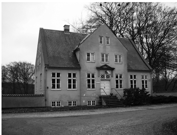
Sandholmgård (arkivfoto 2009)

SANDHOLMGÅRD, ELLEBÆKVEJ 11, 3460 BIRKERØD SØNDAG DEN 10. MARTS 2013, KL. 10.00