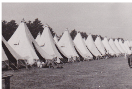
Teltlejr i Oksbøl august