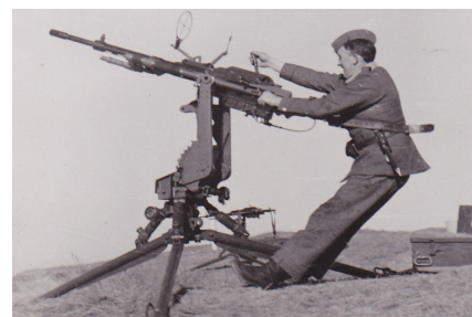
Skytten er på målet