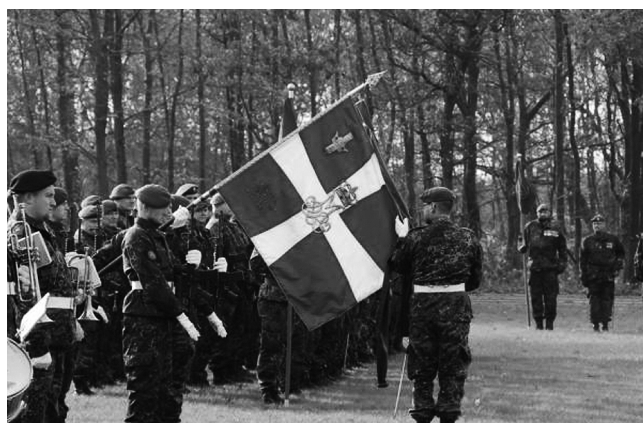
Danske Artilleriregiments Fane.