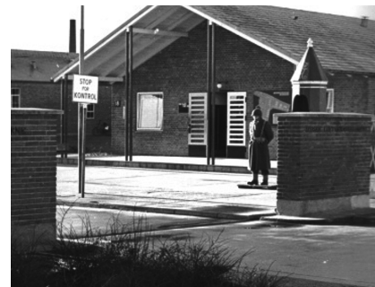
Hvorup Kaserne (Arkivfoto)