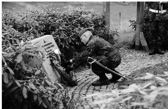
Kransenedlæggelse for faldne artillerister.

Regimentschefen taler til regimentet med faner fra soldaterforeninger i baggrunden.