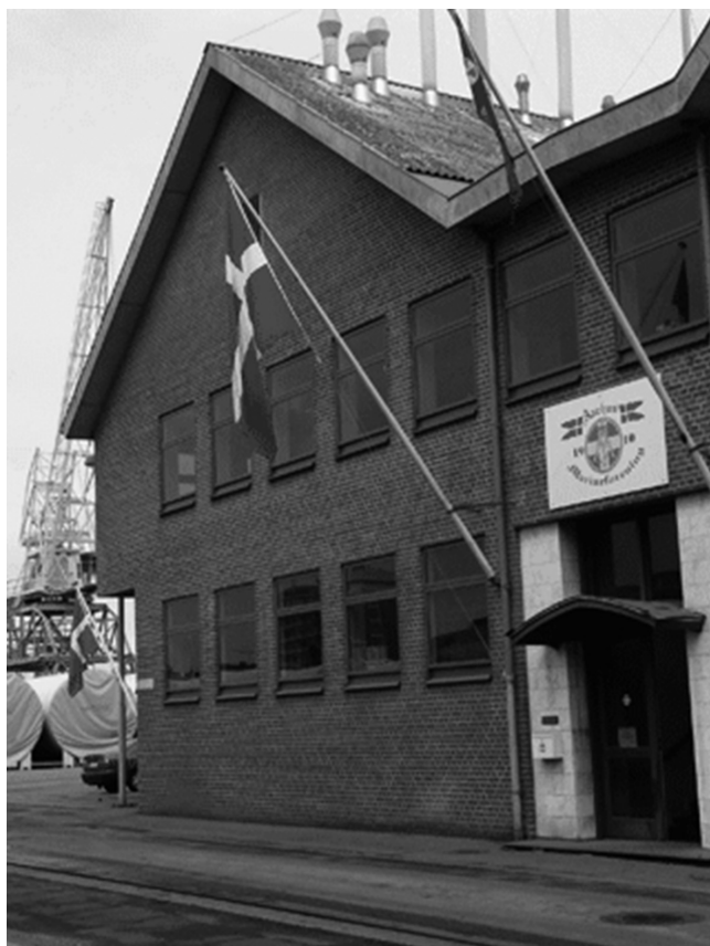
Aarhus Samarbejdende Soldaterforeningers lokaler, Kovnogade 2, Aarhus