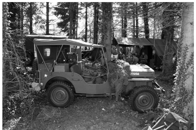
Jeep (arkivfoto 2012)