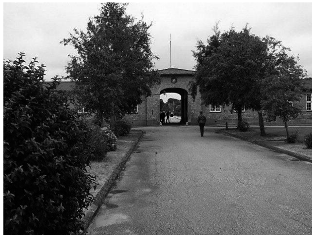
Tønder Kaserne (arkiv 2011)

eksamen, ville jeg sikkert have valgt at udsætte militærtjenesten, til jeg var helt færdig med læsningen. I øvrigt har jeg nu meldt mig til filosofikum, som man nu kan tage her på kasernen.