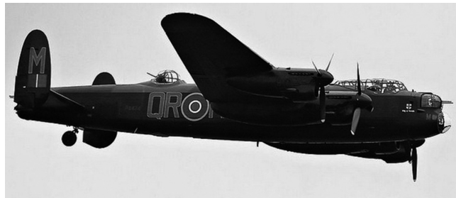
Lancaster på besøg i Danmark sommeren 2012.

Lørdag den 25. maj 2013, kl. 14.00 , bliver den afsløret af bl.a. Borgmester Søren Pape Poulsen, Viborg. Der vil deltage faner fra Forsvaret, Hjemmeværn og soldaterforeninger, her vil Luftværns-Artilleri-Foreningen, Midt-Vest Afdeling deltage med deres fane.