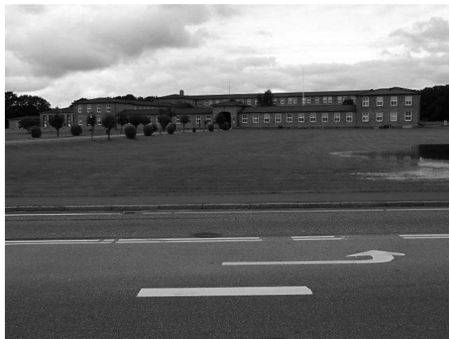
Tønder Kaserne (arkiv 2011)

Vi har ladet spørgsmålet gå videre til nogle soldater på kaserne i Tønder, og vi har blandt andet spurgt om, hvad de ville råde de unge til, som snart står over for at skulle tage det ofte så vanskelige valg.