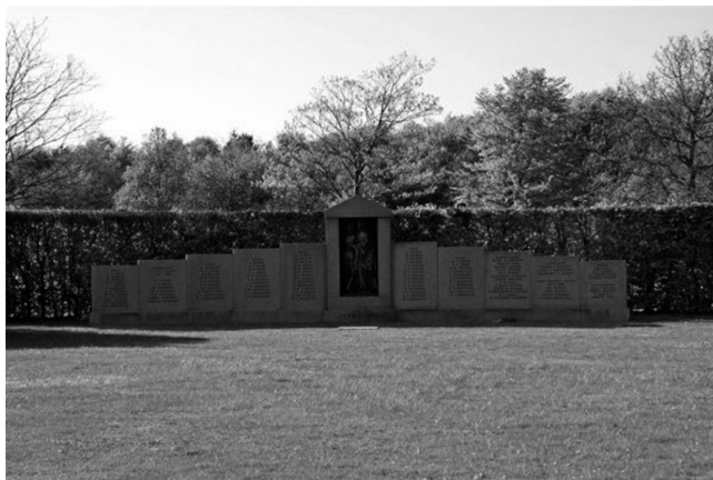
Mindestenen (arkivfoto 2011)

I samarbejde med soldaterforeninger i Esbjerg og Varde bliver der afholdt en mindehøjtidelighed ved Mindestenen i Gravlunden, Esbjerg.