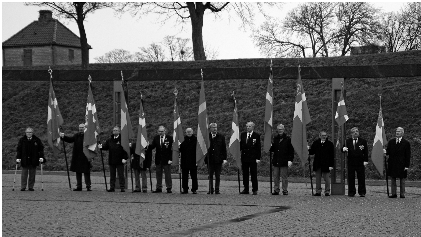
LAFs fane nr. 3 fra højre

Landsforeningens fane deltog i nytårgudstjenesten i kirken på Kastelet samt blomsternedlæggelse ved Monumentet for Danmarks Internationale faldne soldater den 6. januar 2013.