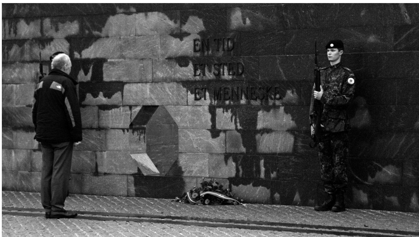
Præsidenten for Danske Soldaterforeningers Landsraad lagde en buket blomster