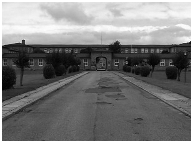
Tønder Kaserne (arkiv 2011)

Mange er af den opfattelse, at det er rarest først at gennemgå sin uddannelse for dernæst at blive soldat. Man undgår derved i værnepligtstiden at tænke på, at man først bagefter skal til at begynde sin uddannelse og først langt senere begynde at tjene mange penge.