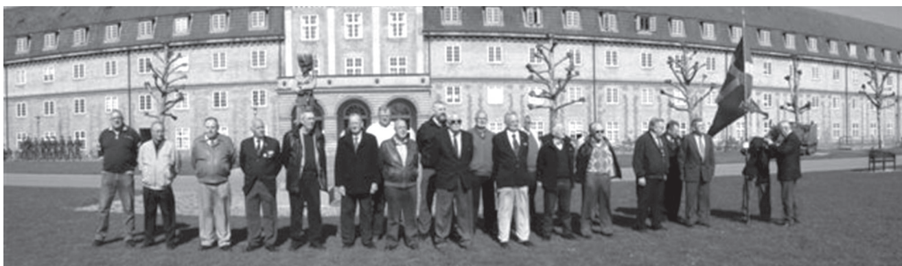
De samlede jubilarer