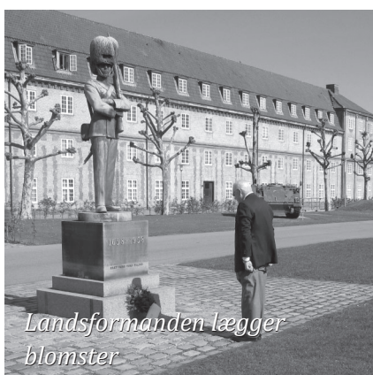
Landsformanden lægger blomster