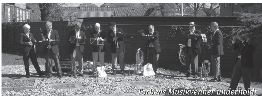
Torbens Musikvenner underholdt