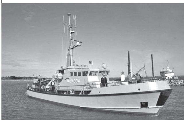
MHV 904 på sin jomfrurejse den 30. september 2005