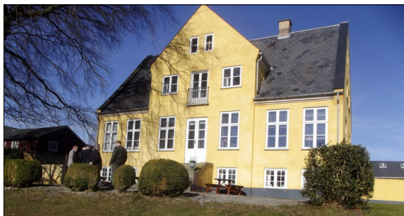
Sandholmgård fra havesiden (arkiv)

Vi mødes ved Sandholmgård, Ellebækvej 11, 3460 Birkerød