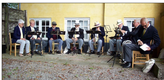
Jernløse Hornorkester underholder (arkiv)