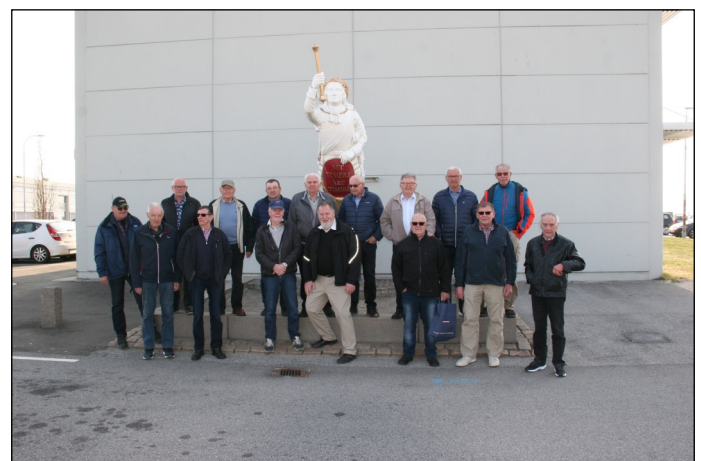
Deltagere i besøget på flådestation

Ved middagstid kørte alle mand til Sæby og besøgte Jacobs Fiskerestaurant hvis store frokostbuffet var mere end rigeligt til alle, ingen fik vist smagt det hele, der var stor enighed om at en sådan event godt kunne gentages.