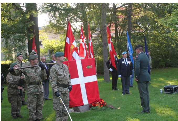
Arkivfoto fra 2018 - Ansgar Anlæg, Odense

(Sammen med de andre fynske soldaterforeninger)