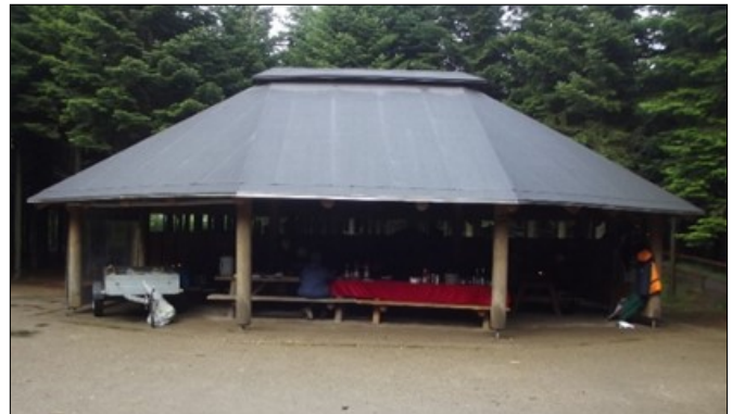
Grillhytte i Alslev (arkiv)