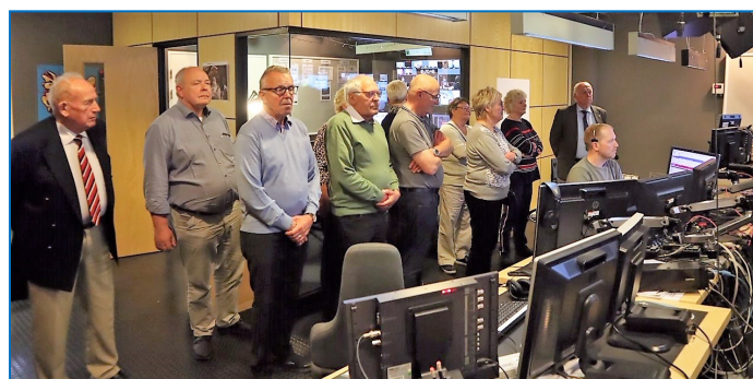
Foto af deltagere