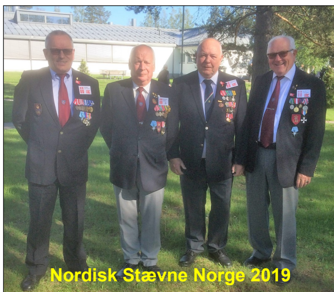
Nordisk Stævne Norge 2019

Hvis du er en af dem, så meld dig til og mød op.