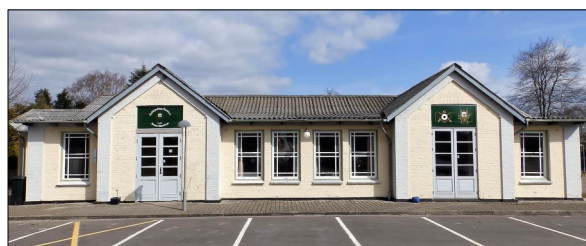
Tønder Skyttekorps Lokaler