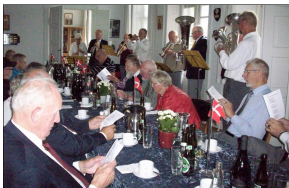
Fællessang med Jernløse Hornorkester (arkiv)