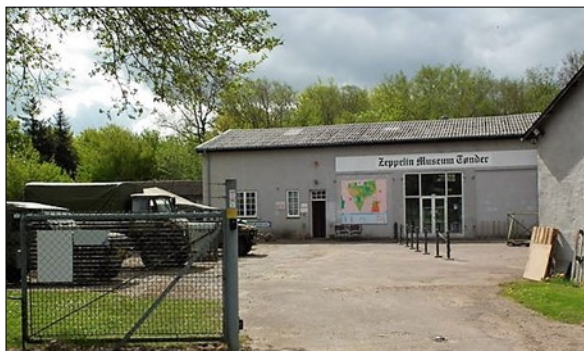
Zeppelin- & Garnisonmuseum Tønder

Vi mødes ved Zeppelin- & Garnisonmuseum Tønder, Gasværksvej 1, 6270 Tønder