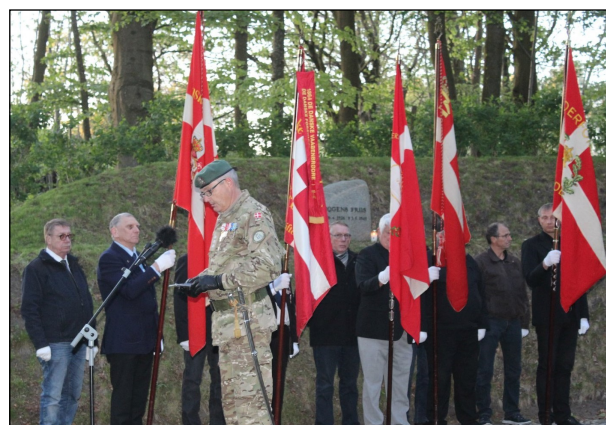
Luftværns-Artilleri-Foreningen, Esbjerg Afdelings fane har deltaget i markeringen af den 4. maj 2019 i Mindelunden i Arnbjerg Anlægget i Varde.