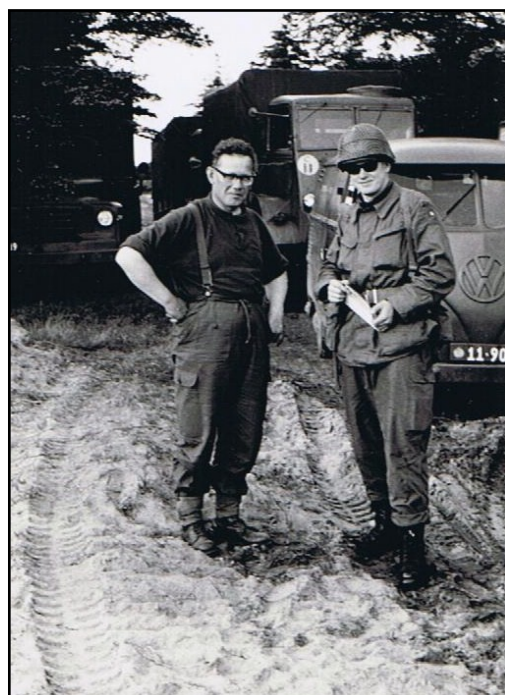
Overfenrik og LT i Felten