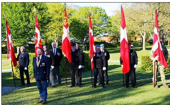
Luftværns-Artilleri-Foreningen, Esbjerg Afdelings fane har deltaget i markeringen af den 4. maj 2019 i Gravlund i Esbjerg.

På adressen: EFI-Hallerne. Sportsvej 21, 6705 Esbjerg Ø