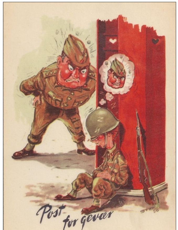
Sjove kort fra en svunden tid