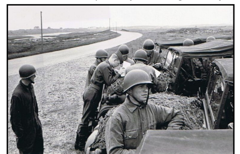
Hvor skal vi placere de Oper?