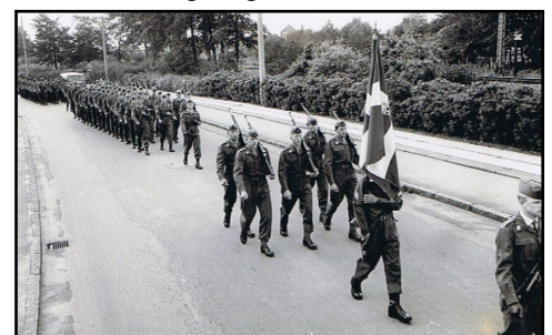
March i Tønder med Jyske Luftværnsregiments fane