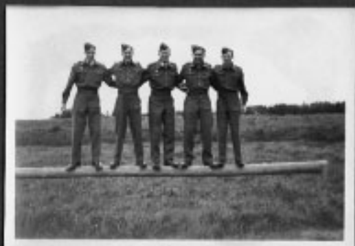
79. Glade gutter 1948