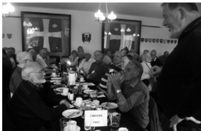
LAF Aalborgs formand siger et par ord til sin egen årgang 1963 og takkede dem som sørgede for at så mange mødte op for at møde deres gamle kammerater.