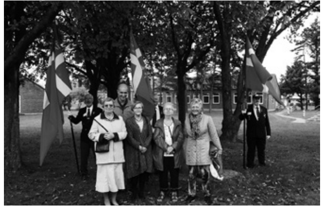
Pårønde til deltagende Laffer