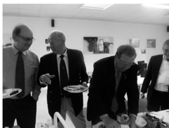
Der snakkes over de overdådige retter.

Så gik man i gang med at indtage de overdådige retter og snakken begyndte at tage til. Der var nogle