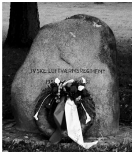
Mindesten på Hvorup Kaserne for Jyske Luftværnsregiment 1953-1961