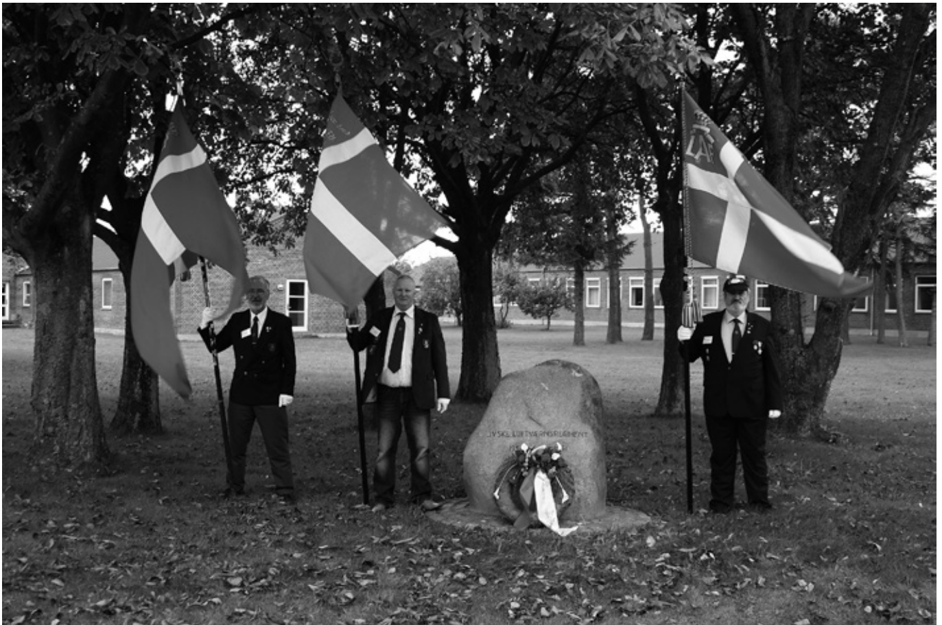
Faner fra Landsforeningen – Aalborg og Esbjerg Afd.