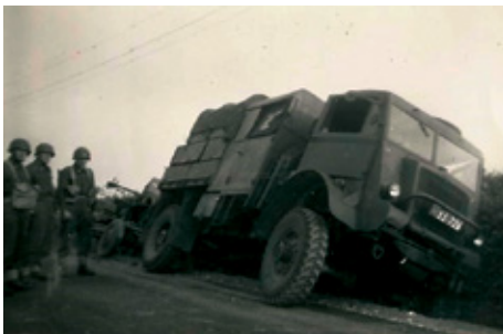
Kanontraktor og kanon i grøft

Foto er leveret af 335512 Preben Honoré som var indkaldt til Jyske Luftværnsregiment, Hvorup Kaserne 1957