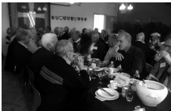
70 Laffer med pårørende til middag i messen.