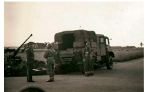
Kanontraktor og kanon i grøft