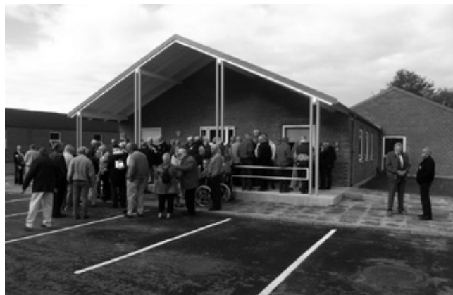
Velkomst og indskrivning vagten Hvorup Kaserne.