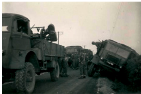
Kanontraktor og kanon i grøft