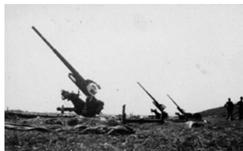
75 mm luftværnskanoner

Batteriet blev ikke afvæbnet, men fik henstilling om at lade sætte geværene sammen og mandskabet