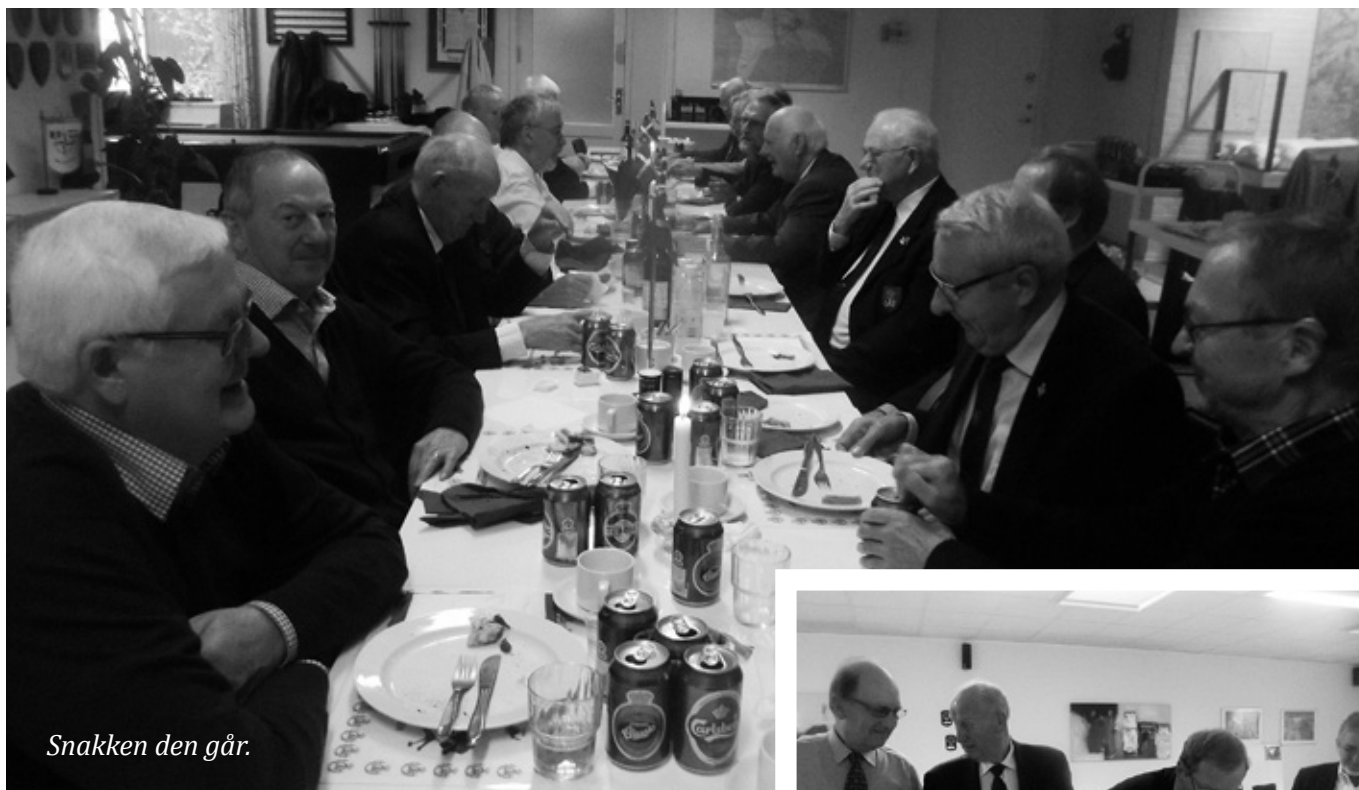
Snakken den går.

GUBBEFROKOST BLEV ATTER I 2013 AFHOLDT PÅ VETERANHJEM TREKANTSOMRÅDET I FREDERICIA.