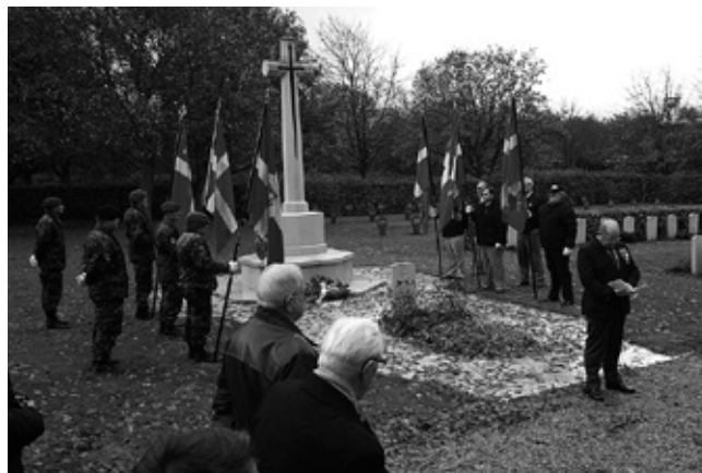
Gravlunden i Esbjerg

Dagens program var opstilling i Gravlunden, kl. 10.45, og efter at fanerne var ført på plads og kranzen lagt blev der blæst "The last post . . ." på to trompeter. Herefter sang man "Kongernes konge . . .", efterfulgt af en kort andagt og der blev sluttet af med at der blev sunget "Altid frejdig . . .".