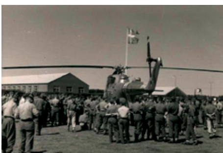
Besøg af helikopter