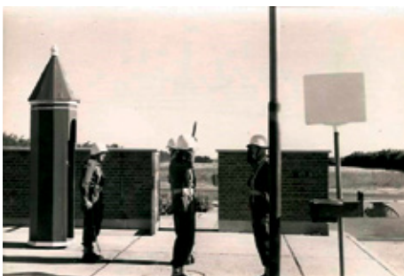
Vagtafløsning i vagten