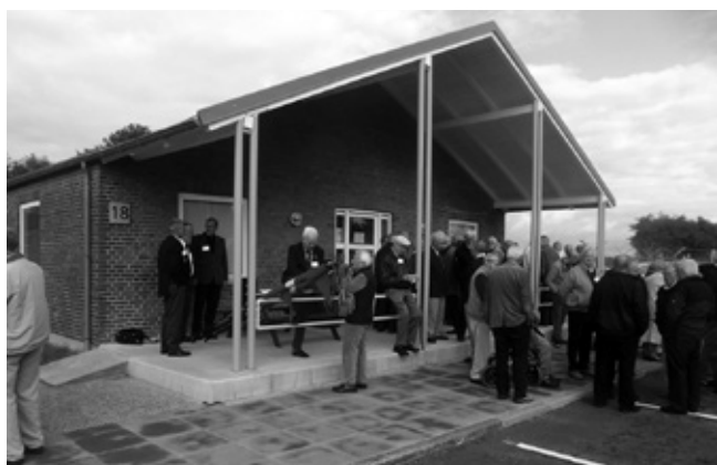
Velkomst og indskrivning vagten Hvorup Kaserne.