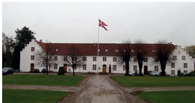
Hovedbygning Søgårdlejren (arkivfoto)