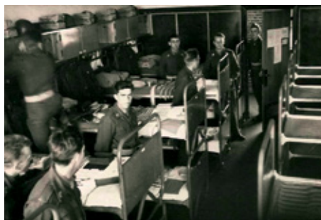
Klar til stueeftersyn