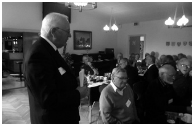
Landsformand iværksætter hvervning af nye medlemmer.