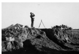
Der observeres på himlen

Lidt efter klokken 12 modtog batteriet ordre fra afdelingen i Røde kro, om at man ikke måtte skyde, da danske flyvemaskiner i løbet af eftermiddagen ville overtage bevogtningen af luftrummet over grænseegnene.